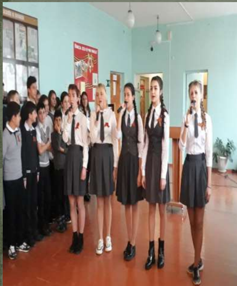
17 декабря 2018 года МБОУ СОШ №12 присвоено имя Героя Советского Союза Исмаила Халаловича Тхагушева