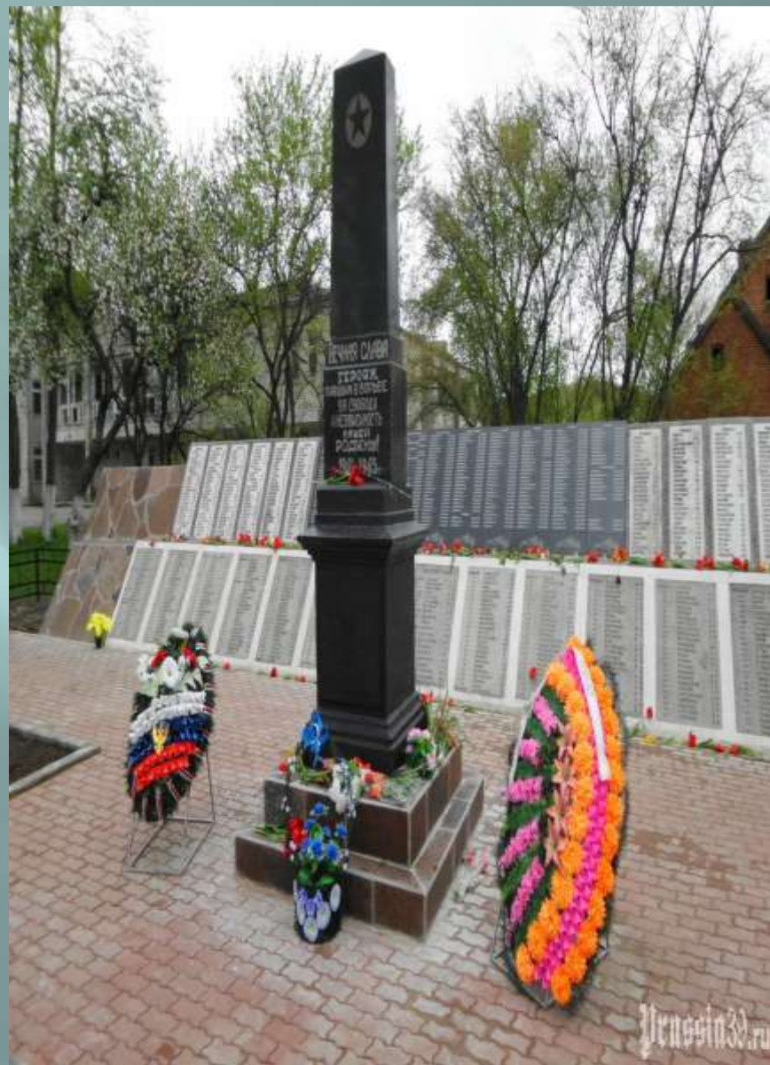
Братская могила в с. Калинино