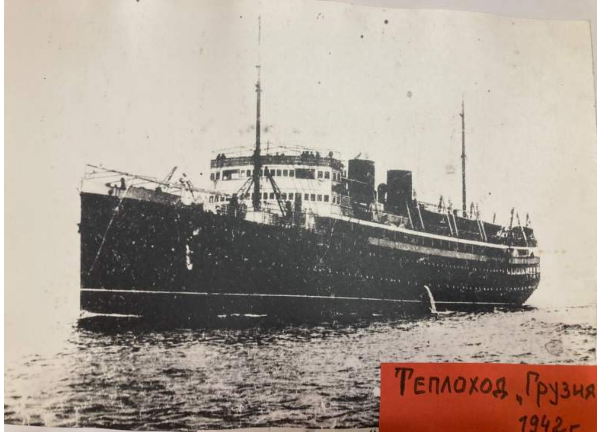
Теплоход "Грузия" 1942г