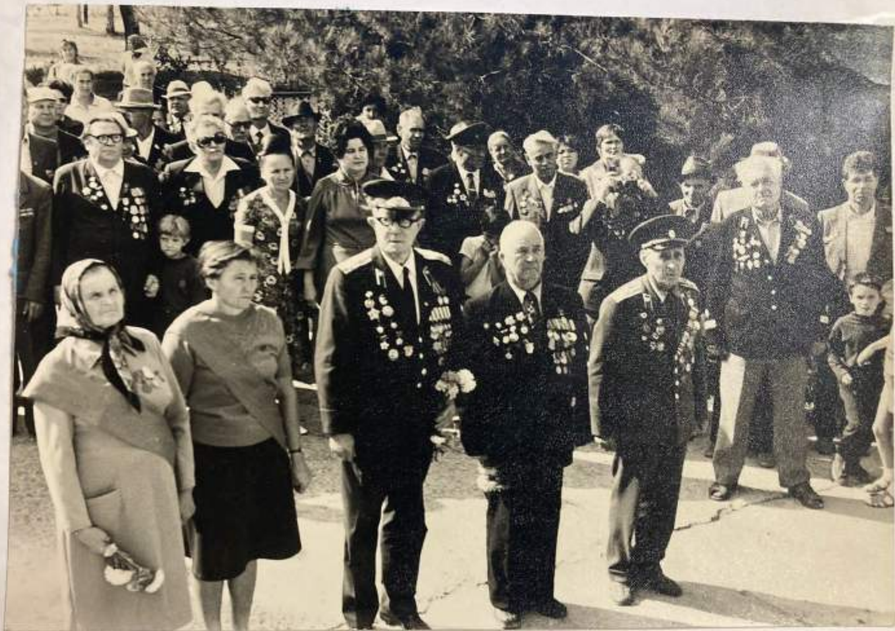
Митинг, посвященный Великой Победе. Ход митинга. 1982 г.