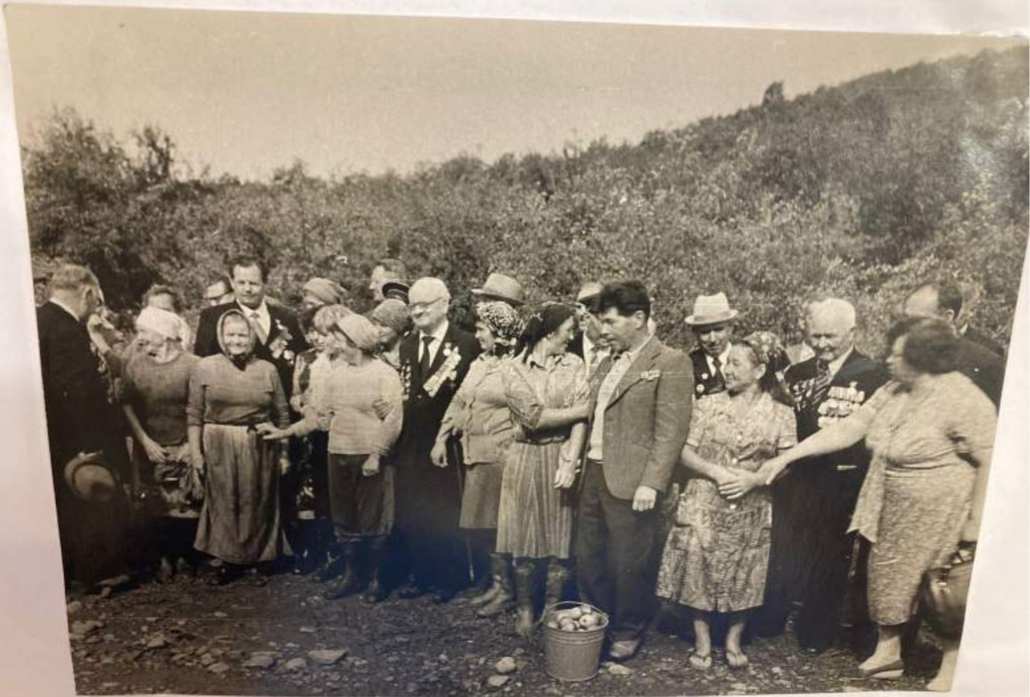
Встреча участников боёв с рабочими садовой бригады плодосовхоза в селе Анастасиевка 10/IX - 82 г.