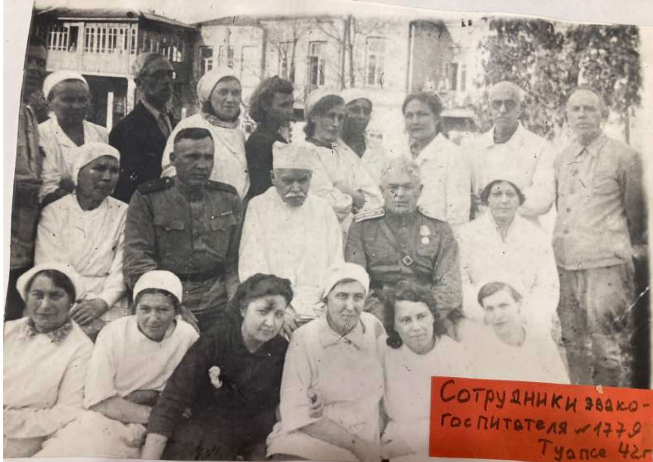
Сотрудники звako- госпитателя №1779 Туапсе 42г