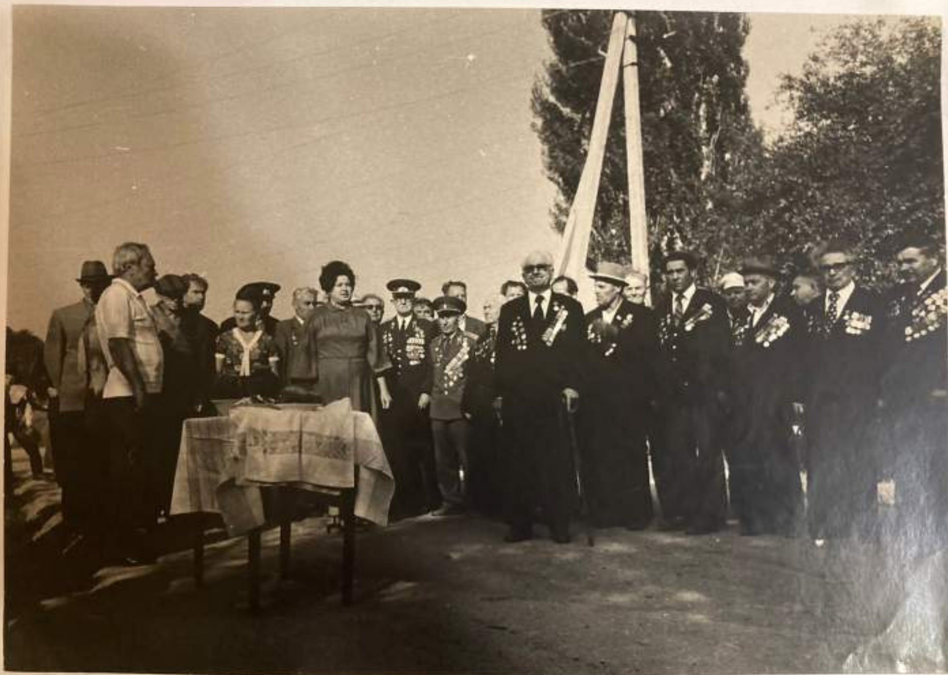
Митинг, посвященный Великой Победе в селе Георгиевском.