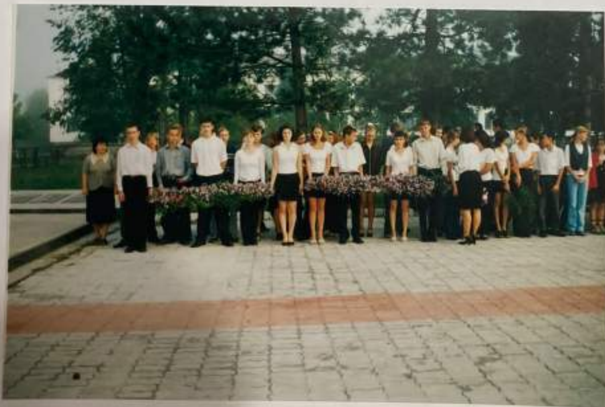
Гирлянды Славы – павшим.