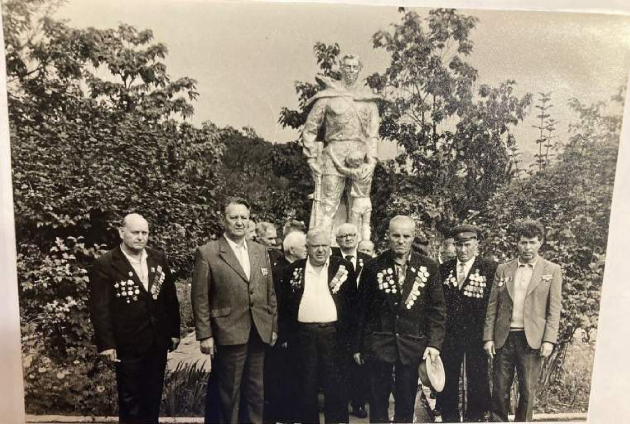
У братской могилы в с. Анастасиевка.