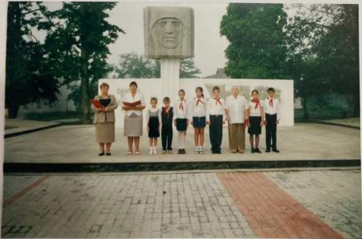
Митинг Памяти павших на Туапсинском направлении. Октябрь. 2003г.