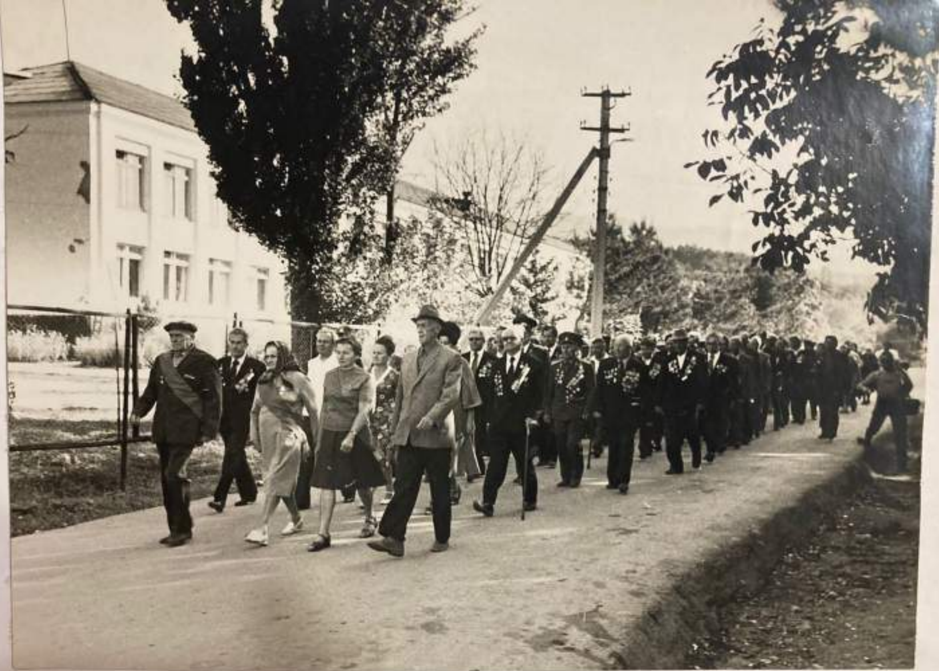
Торжественное шествие трудящихся совхоза, жителей села Георгиевского и гостей-ветеранов войны 8-й гвардейской стрелковой бригады.