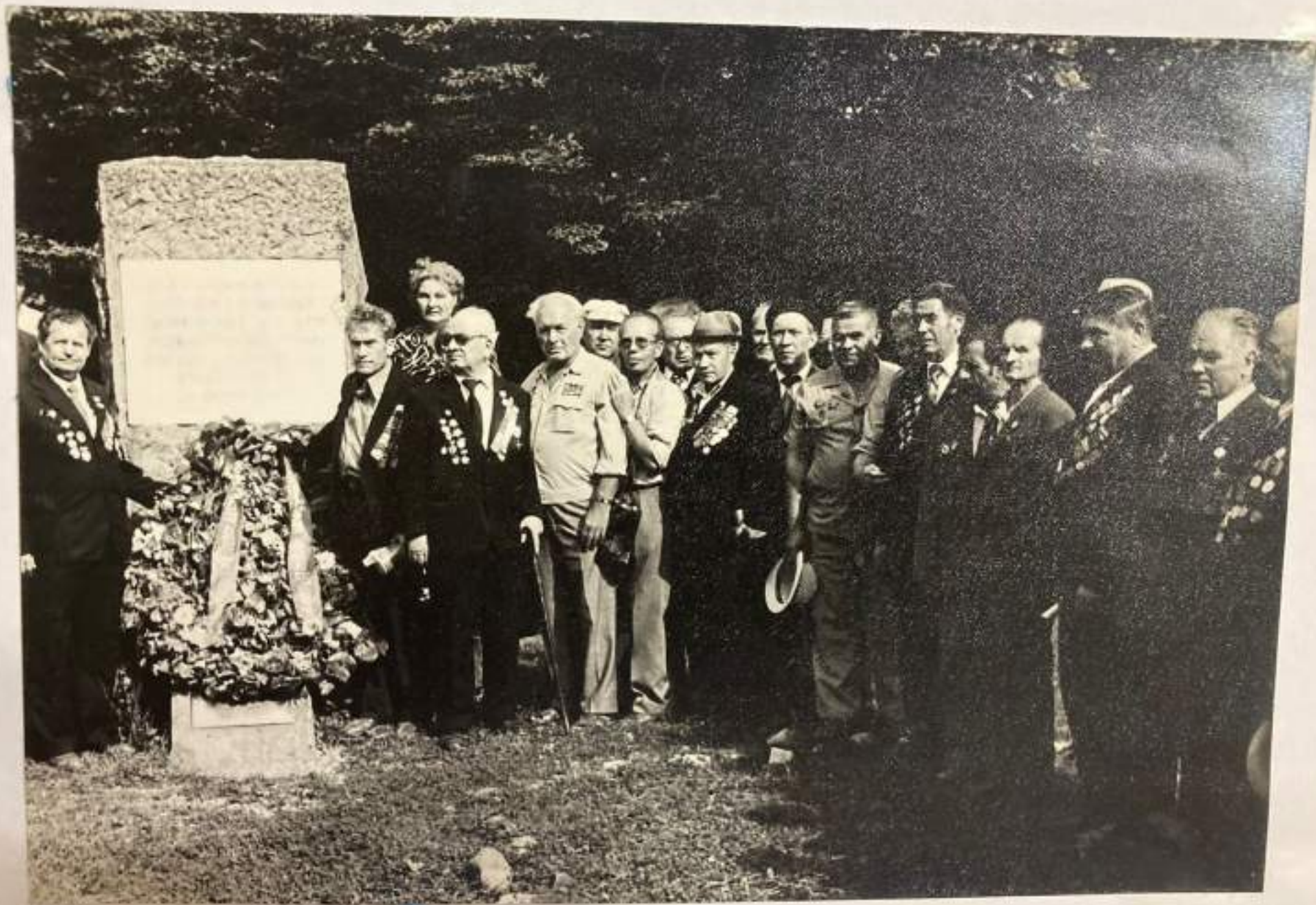
Возложение венков к памятнику.