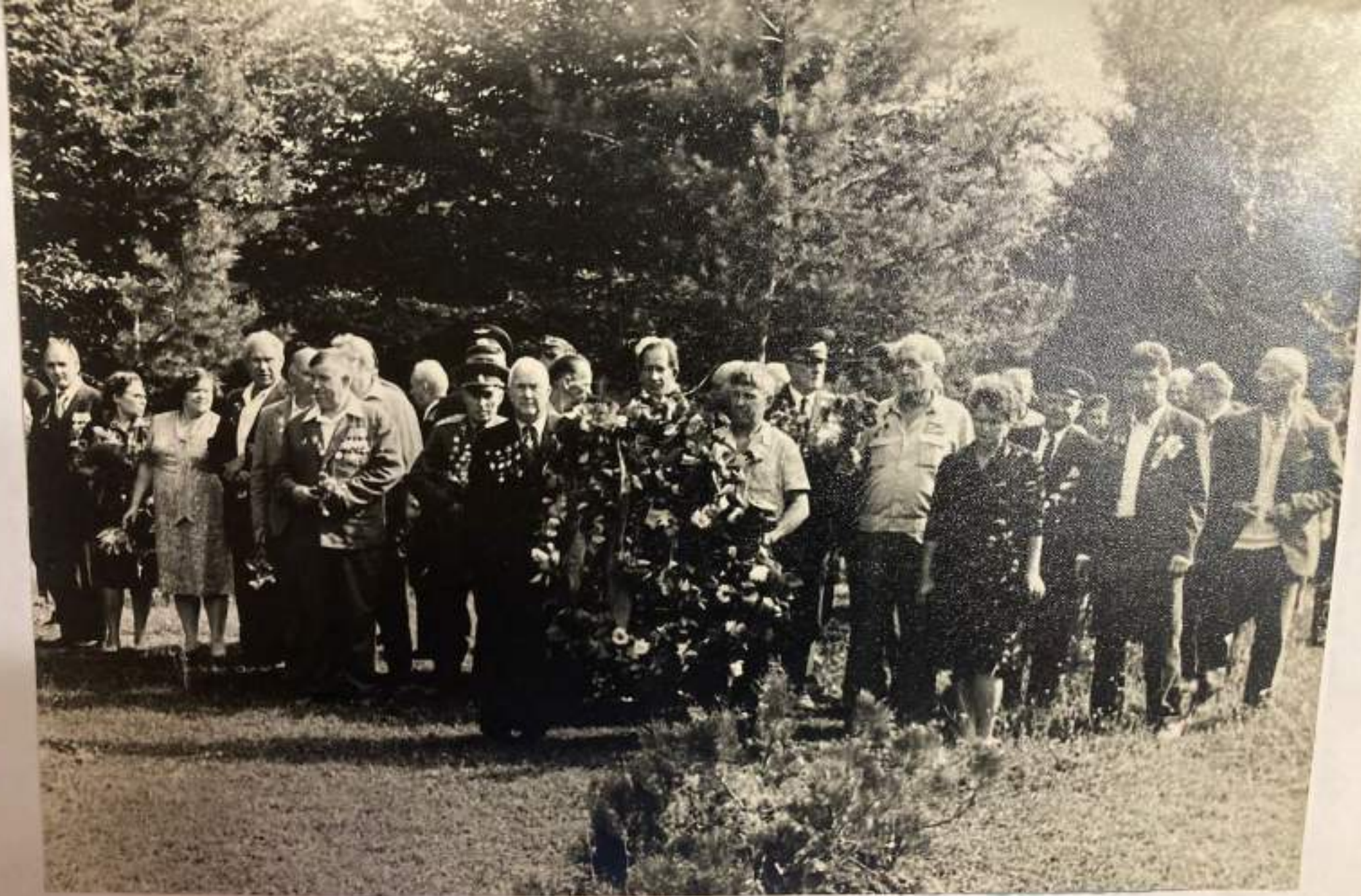
Возложение венков у братской могилы.