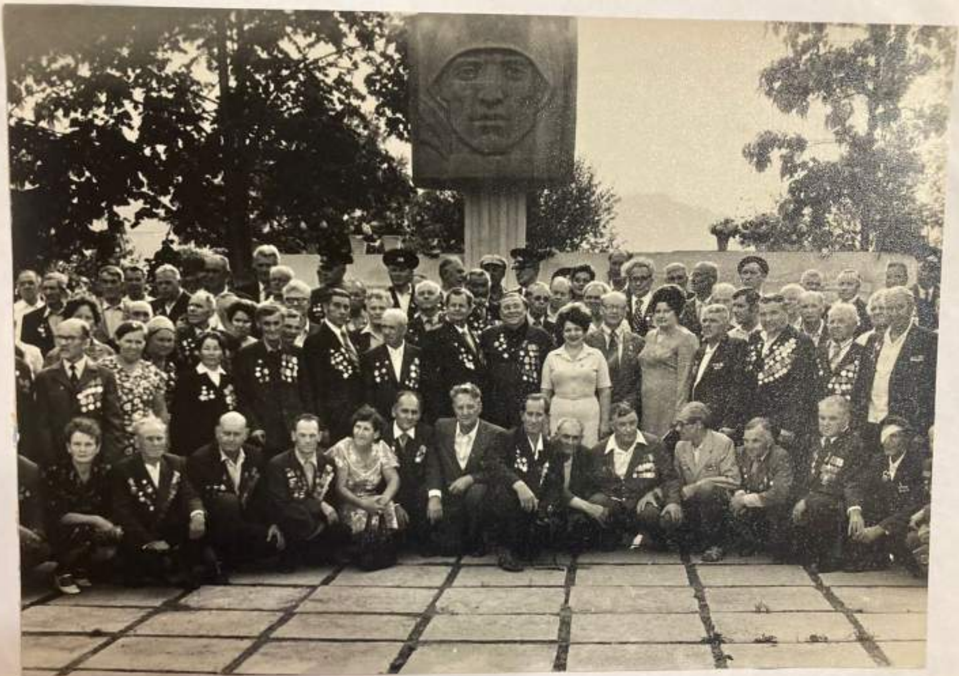
Памятная фотография воинов 8-й гвардейской стрелковой бригады в селе Георгиевском.