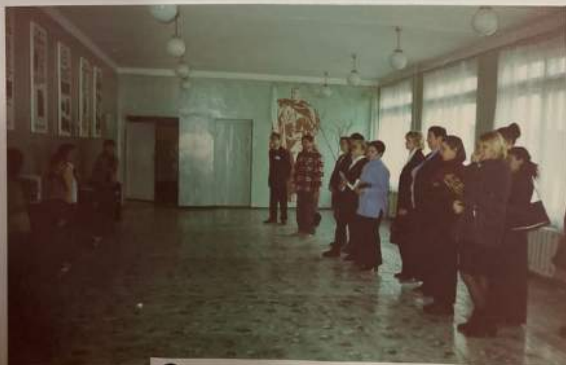
Экскурсия для завучей района.