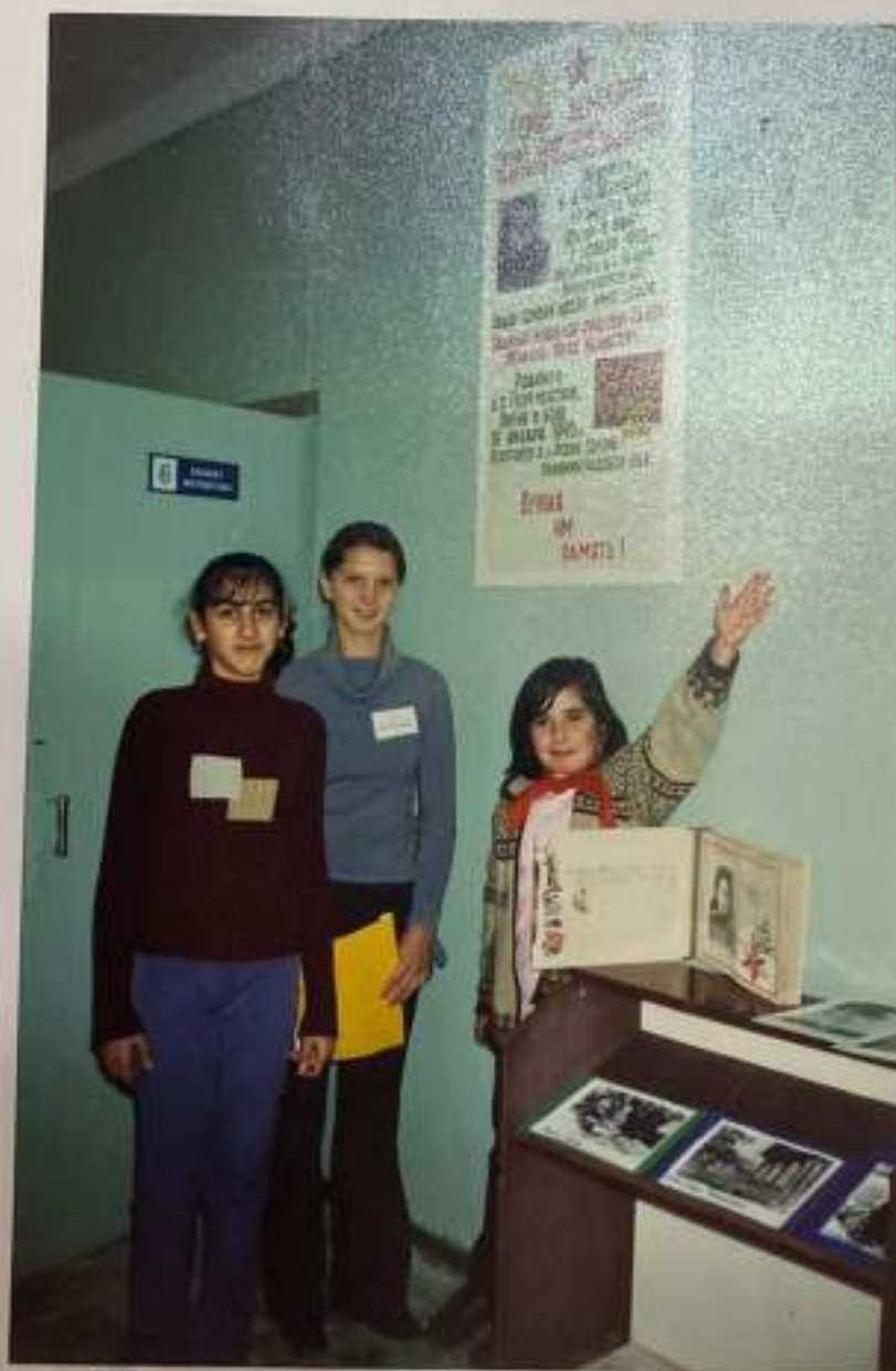
Экскурсия для учащихся.

Родился и вырос на хуторе, женился, переехал в Георгиевку. Работал лесорубом. На фронт ушёл на 2 день войны, 23 июня 1941 года группой молодых мужчин и парней, оставив дома жену и двух маленьких сыновей. Прошёл всю войну почти до Победы. Снайпер, отважный боец, верный товарищ! Воевал под Новороссийском, участвовал в порыве Голубой линии, освобождал Керчь, прошёл – протоптал, прополз. Освобождая землю от фашистов и пал смертью храбрых, в далёкой Калининградской области, в конце апреля 1945 года.