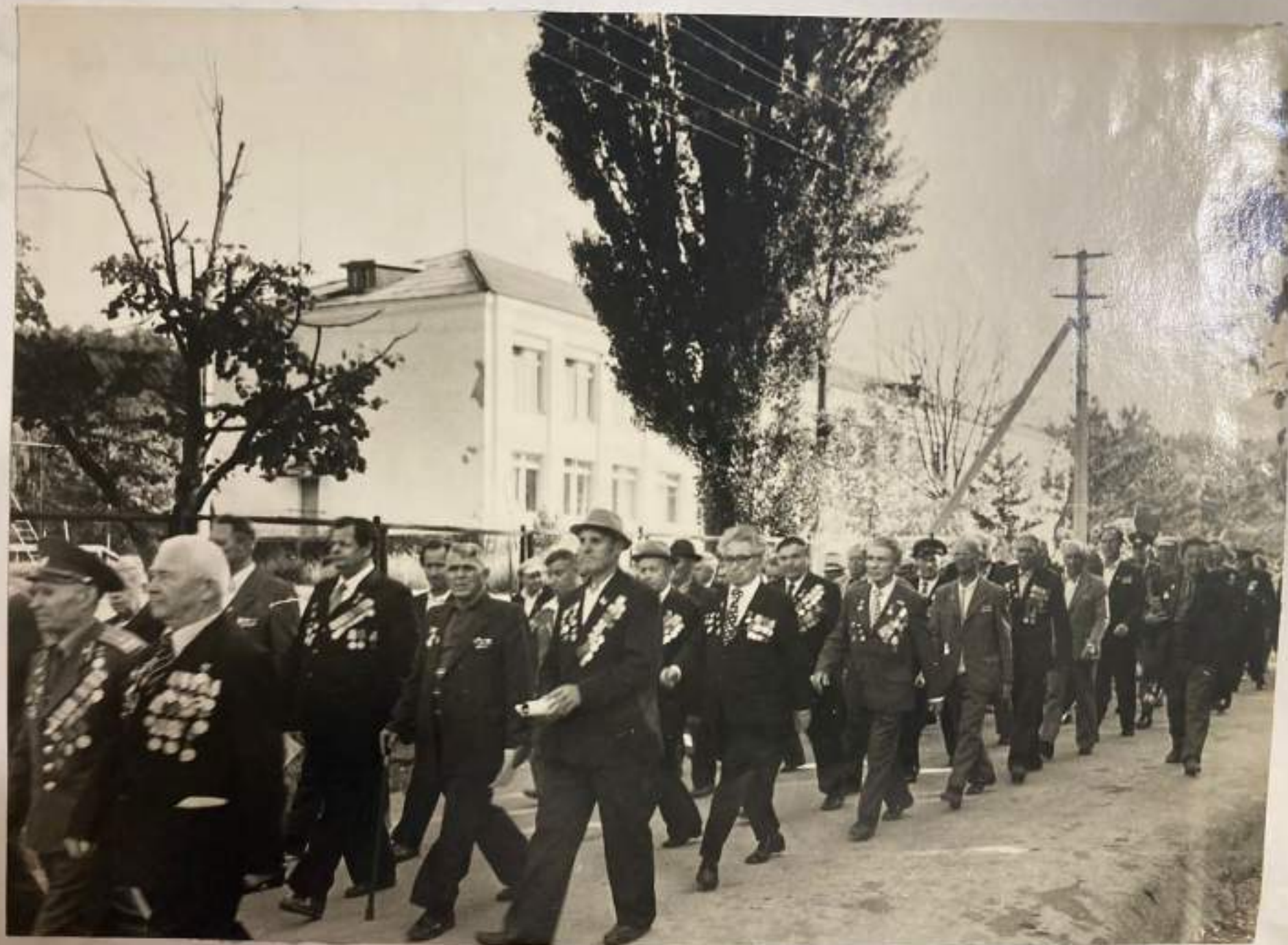
Торжественное шествие трудящихся совхоза, жителей села Георгиевского и гостей 8-й гвардейской стрелковой бригады.