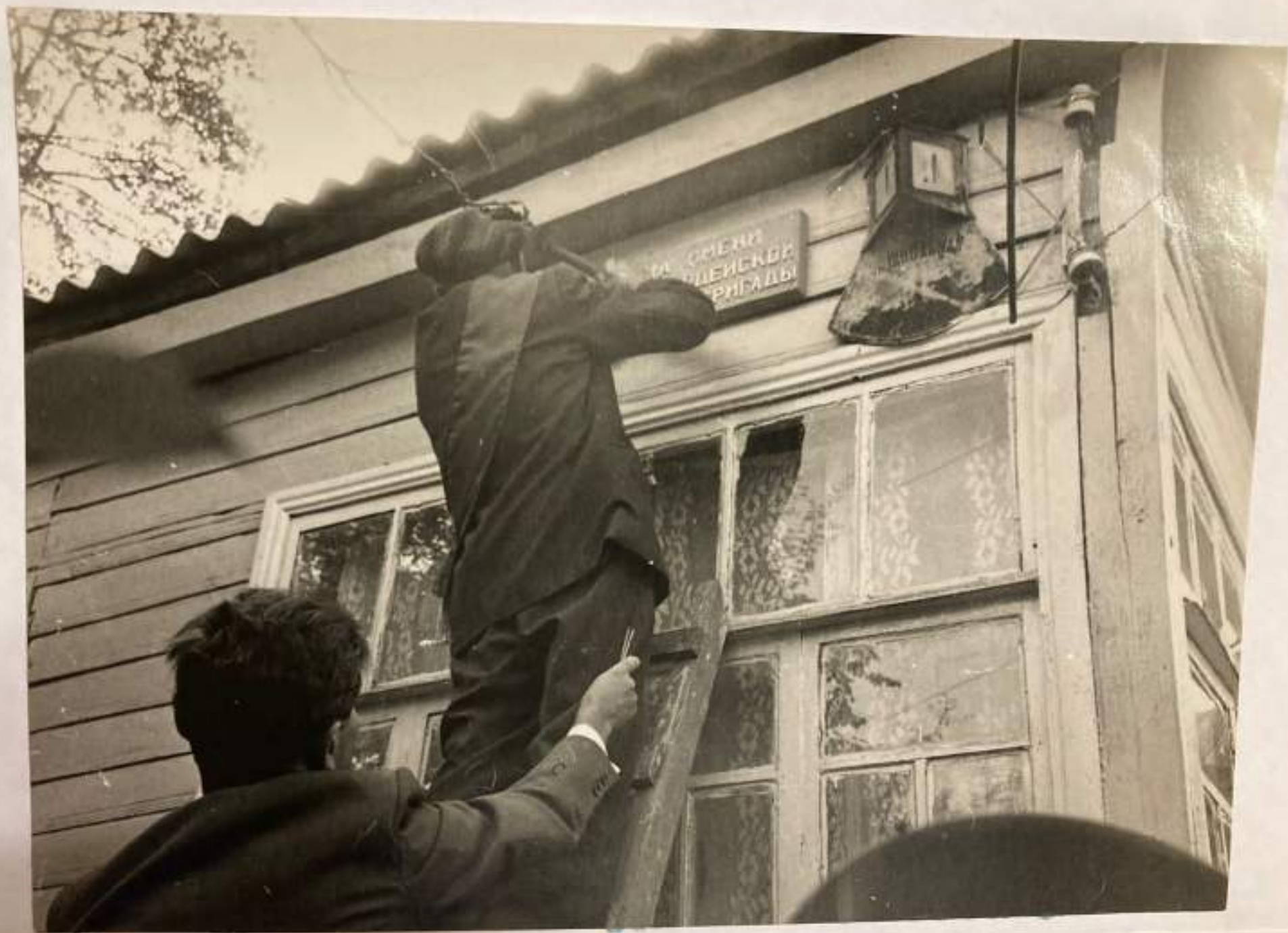
Прикрепление табличек с новым наименованием на первом доме улицы села Георгиевского.