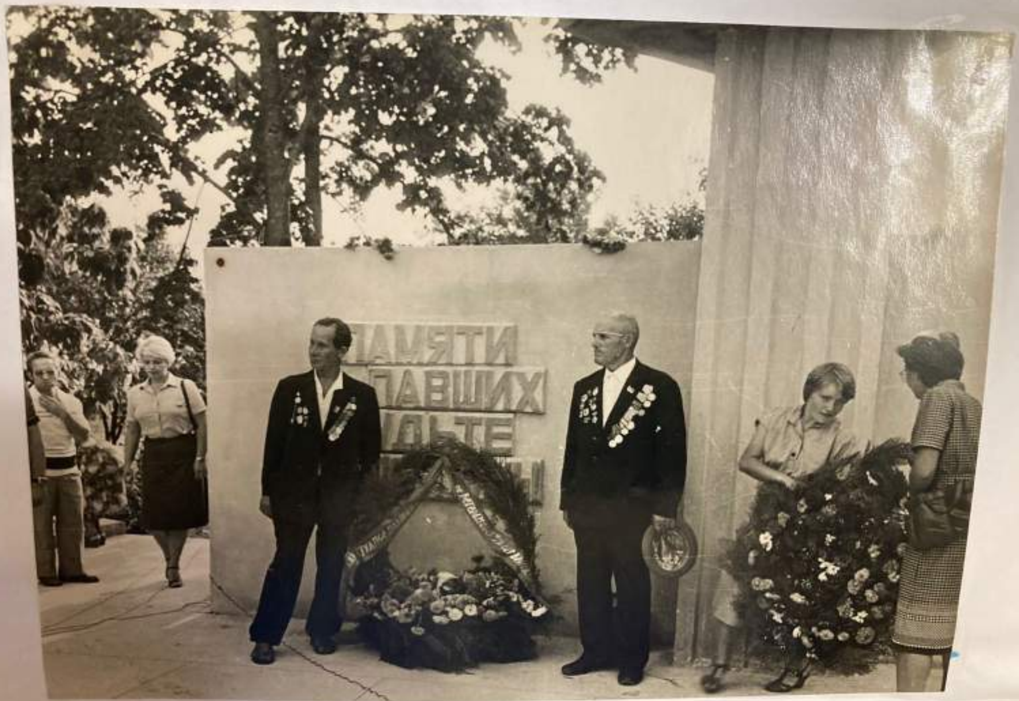
Возложение венков к памятнику.