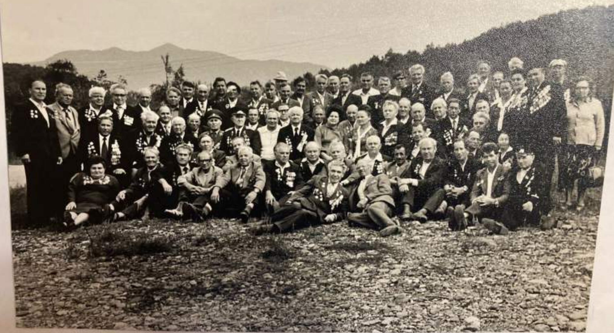
Общая памятная фотография. Ветераны Великой Отечественной войны, войны 8-й гвардейской бригады.