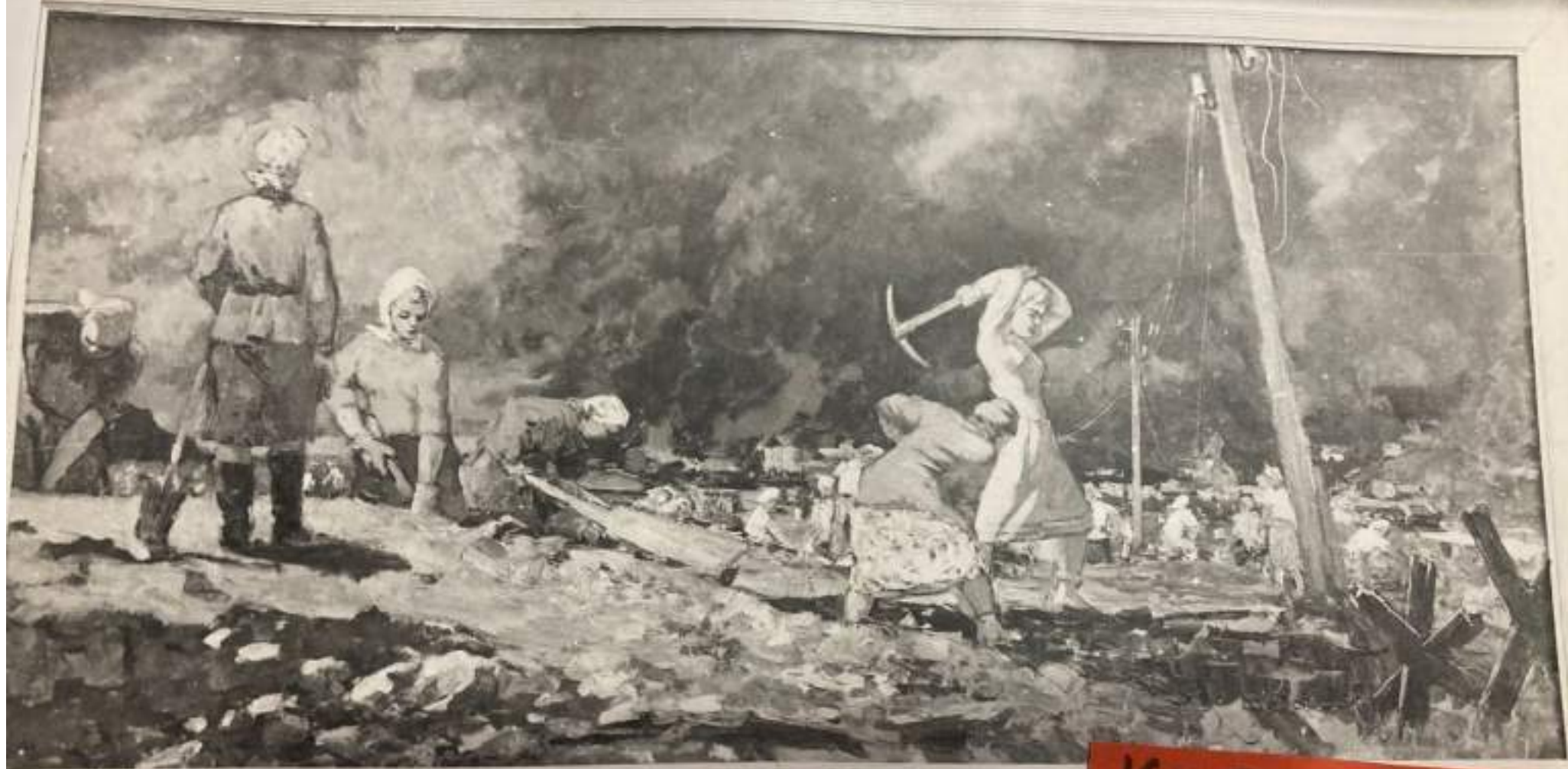
Картина, Строительские оборонительных сооружений руженый худ. В. Хлопуша Туапсе Ч.