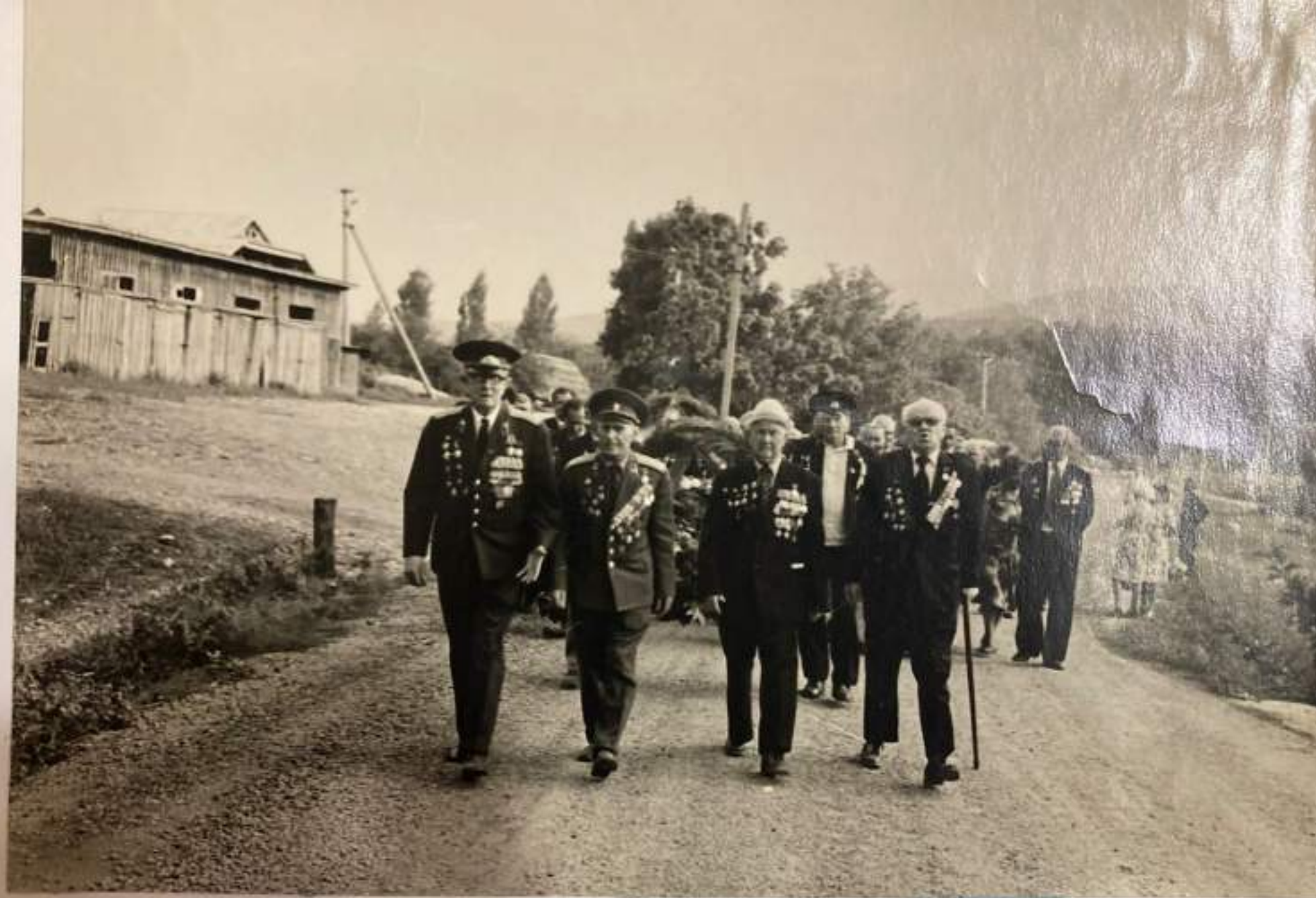
Шествие ветеранов войны - воинов 8-й гвардейской стрелковой бригады к месту сбора для участия в митинге с. Анастасиевка.