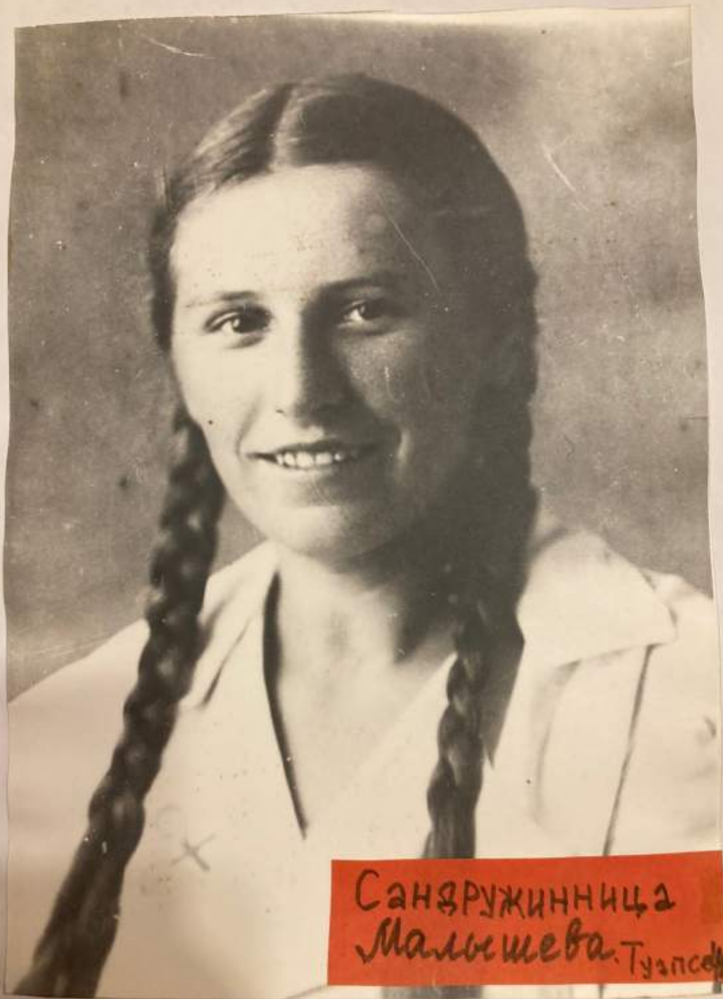
Санзружинница Малышева. Тузлосе