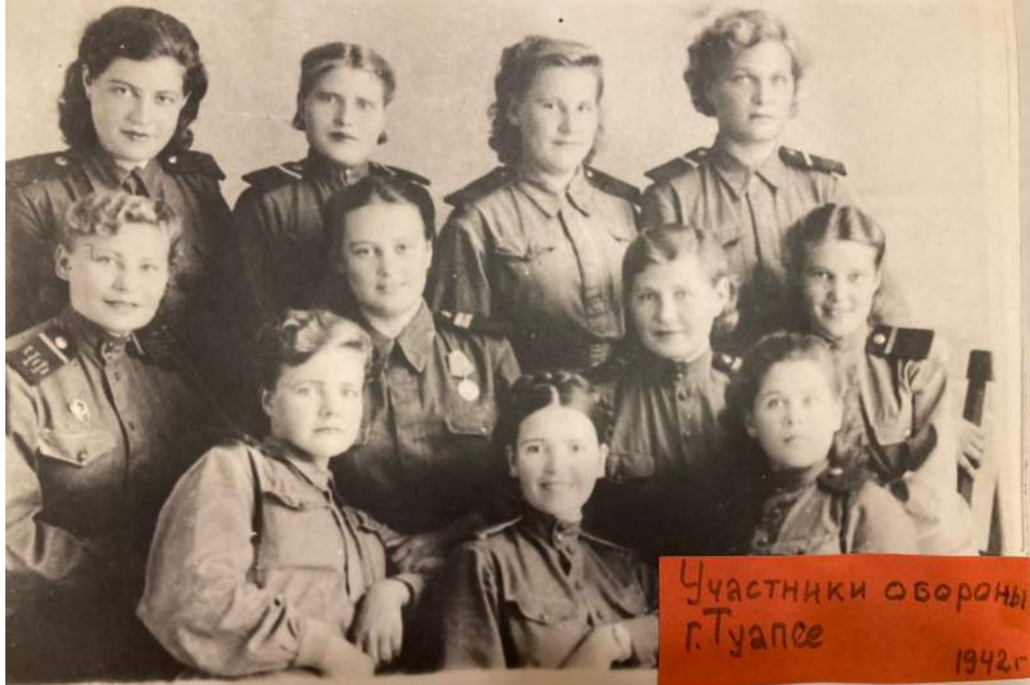
Участники обороны г. Туапсе