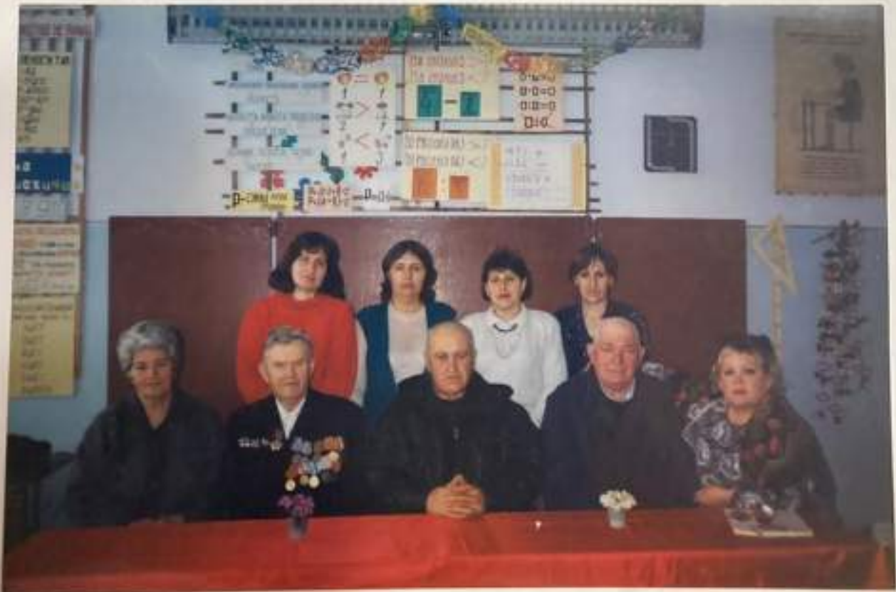
Встреча с ветеранами в школе.