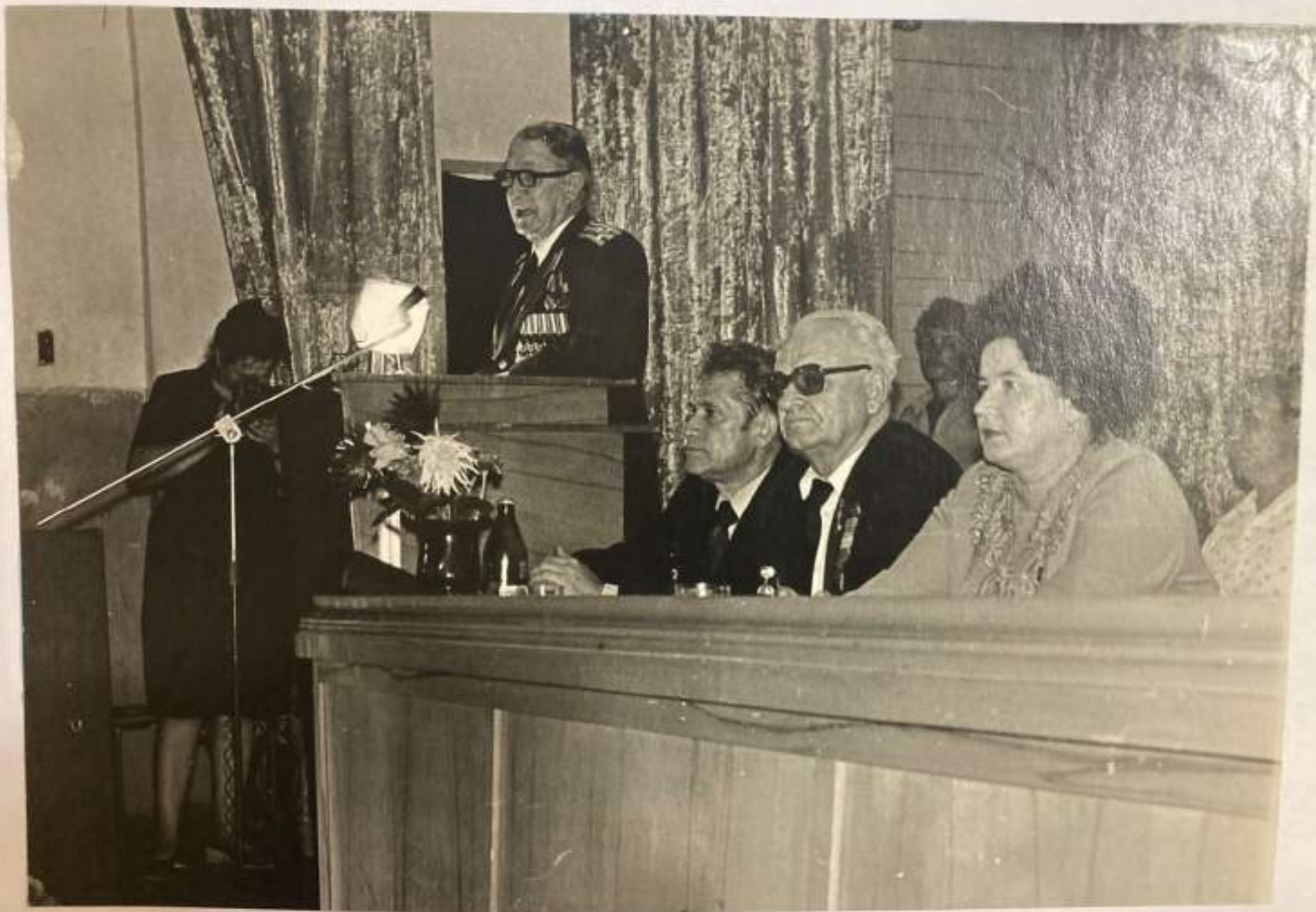
Торжественное собрание в клубе совхоза, посвященное 40-й годовщине боёв за Туапсе с участием представителей совхоза.