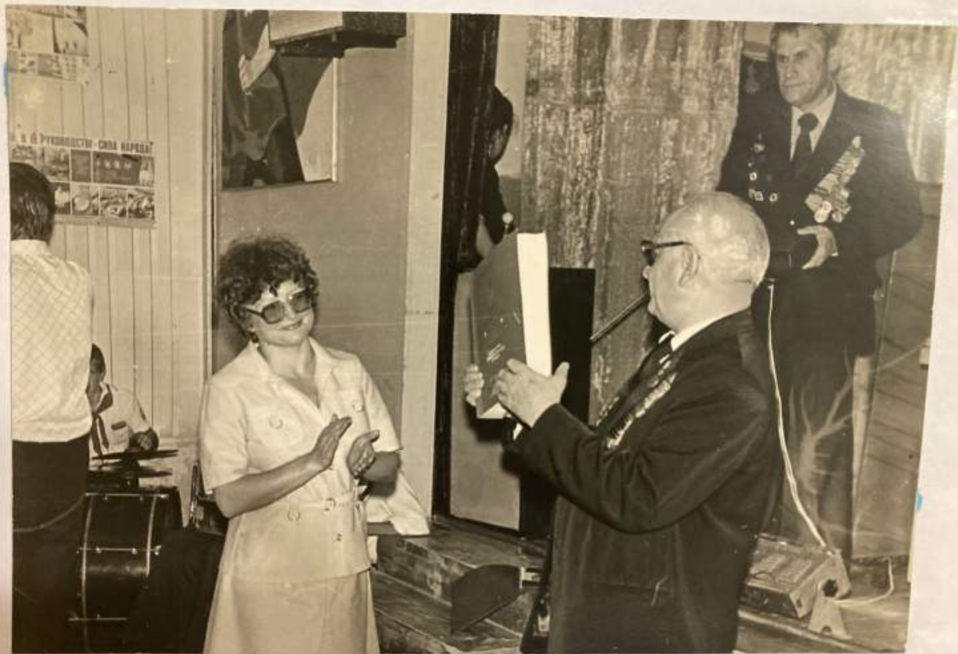
Вручение Туапсинскому историко-краеведческому музею памятной книги-альбома "От Терска до Тамани."