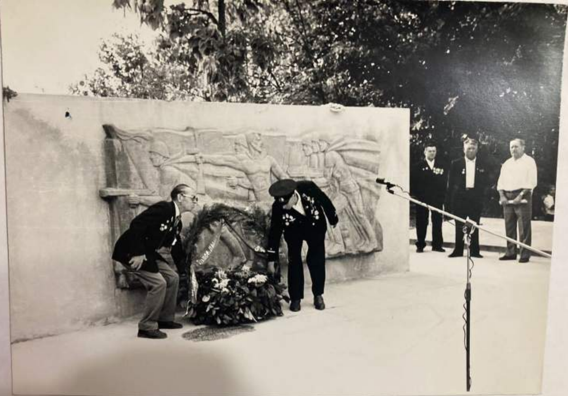
Возложение венков у братской могилы.