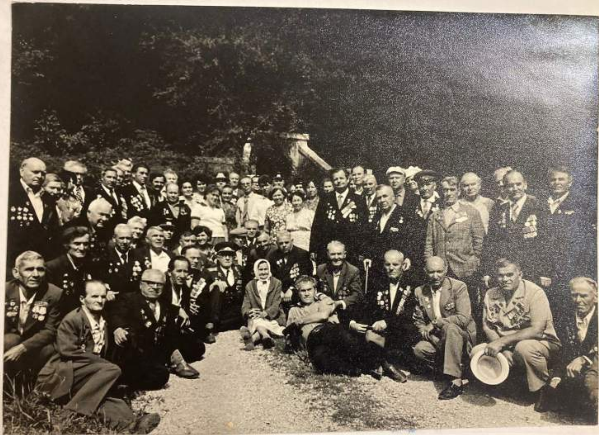
Встреча с жителями пос Индюк, Гойтх.