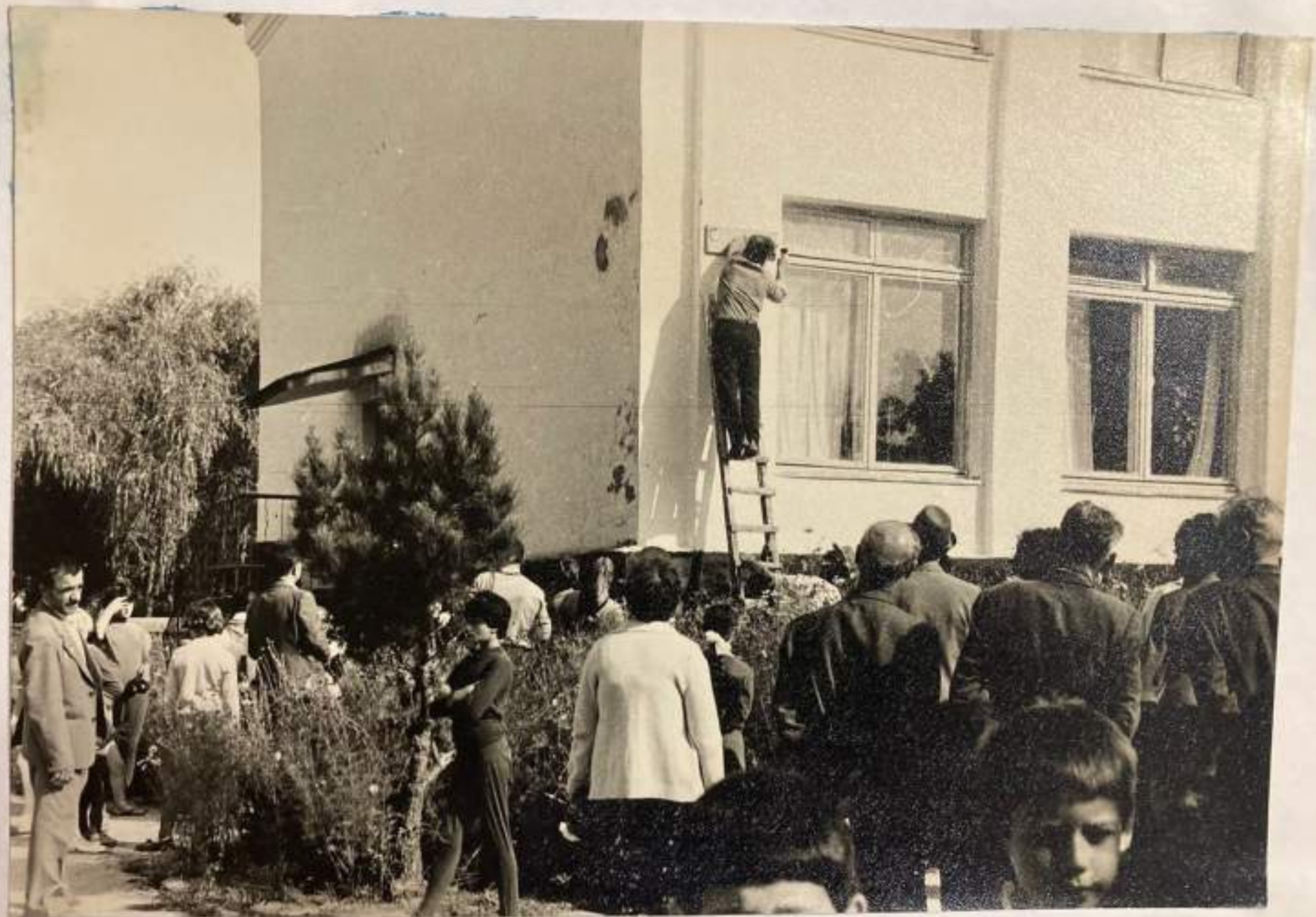
Прикрепление табличек с новым наименованием улицы на школе 12 сентября 1982 г.