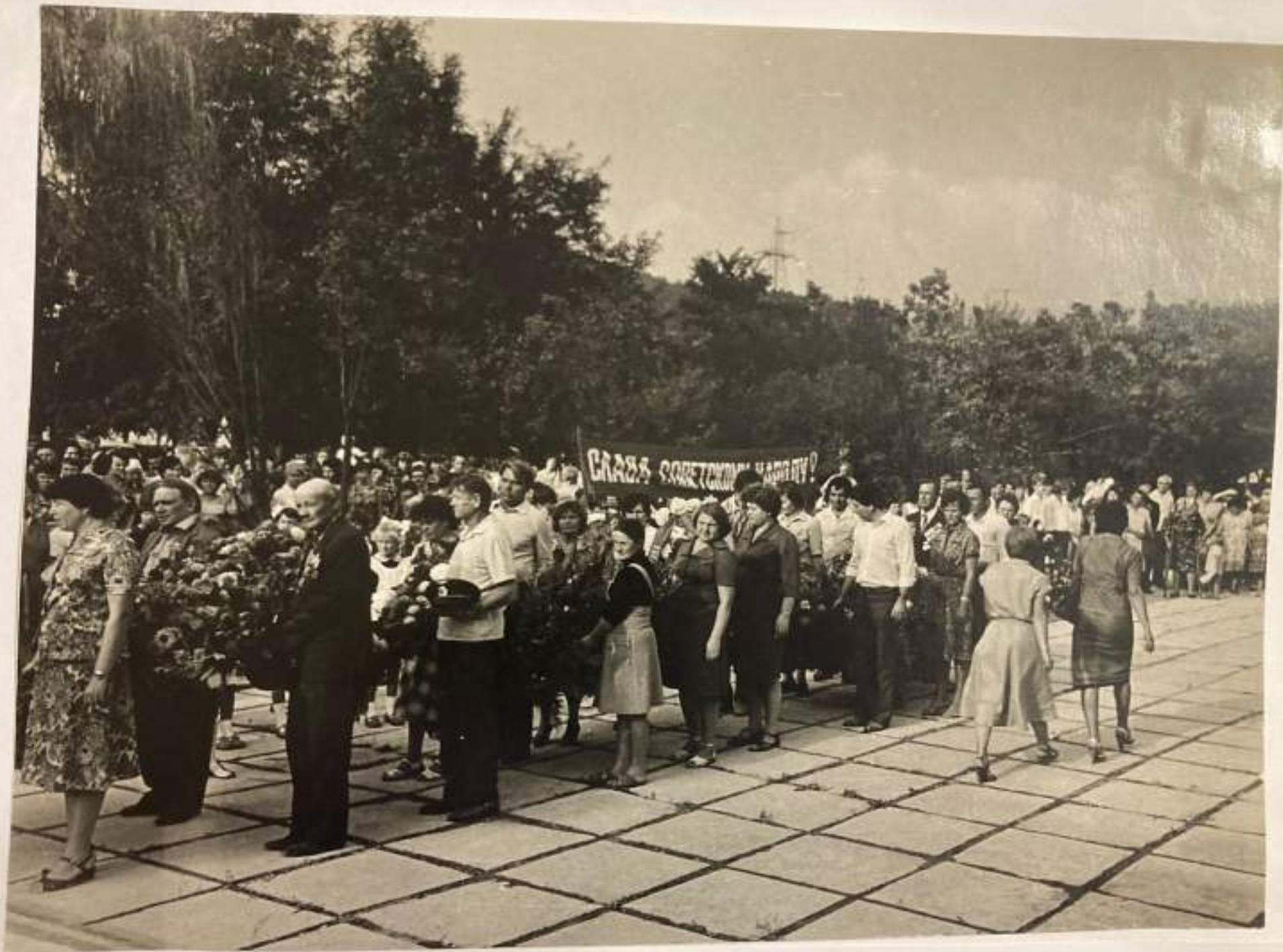
Торжественное шествие к памятнику в селе Георгиевском.