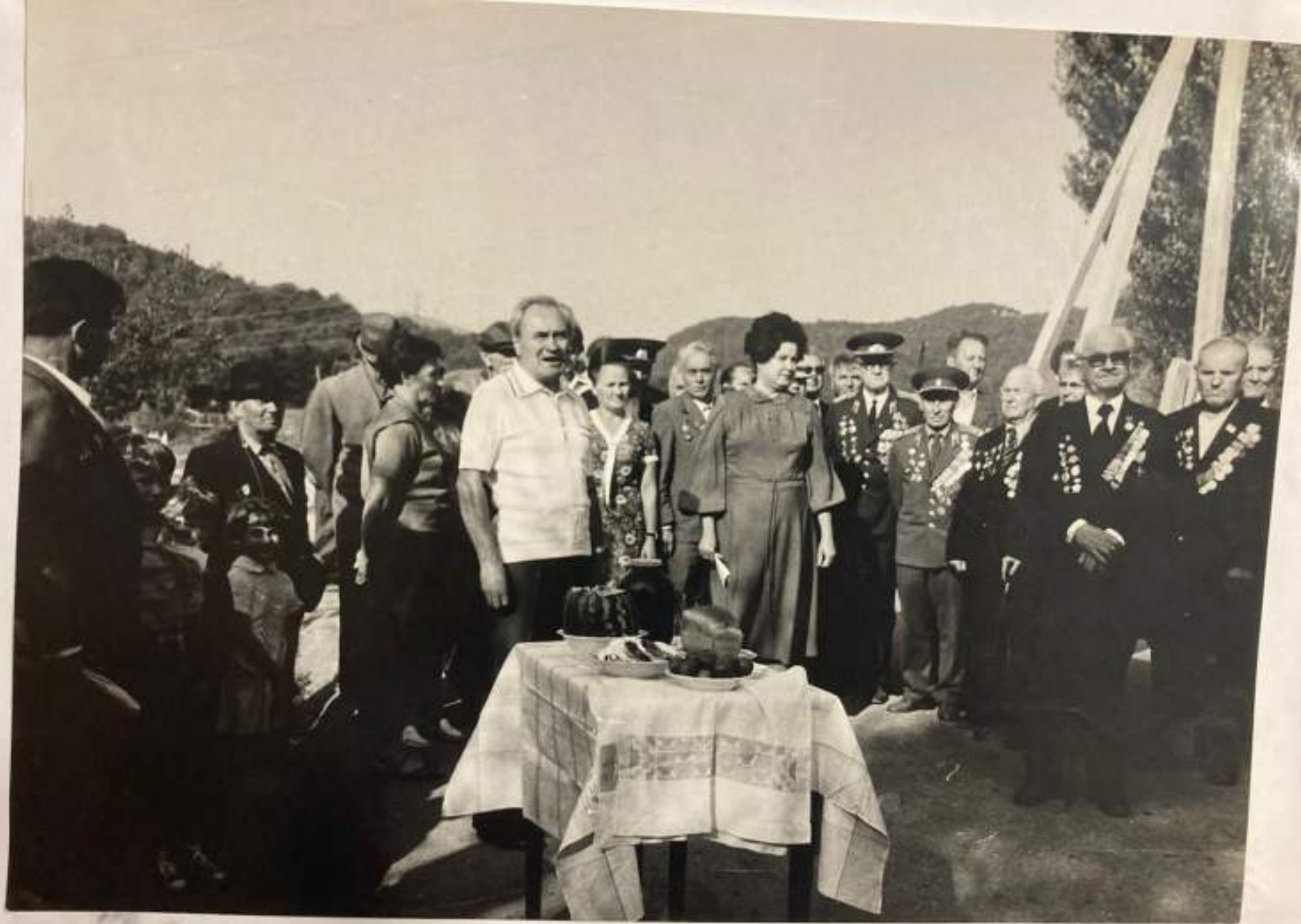
Ветеранов войны - участников боёв встречают хлебом-солью.