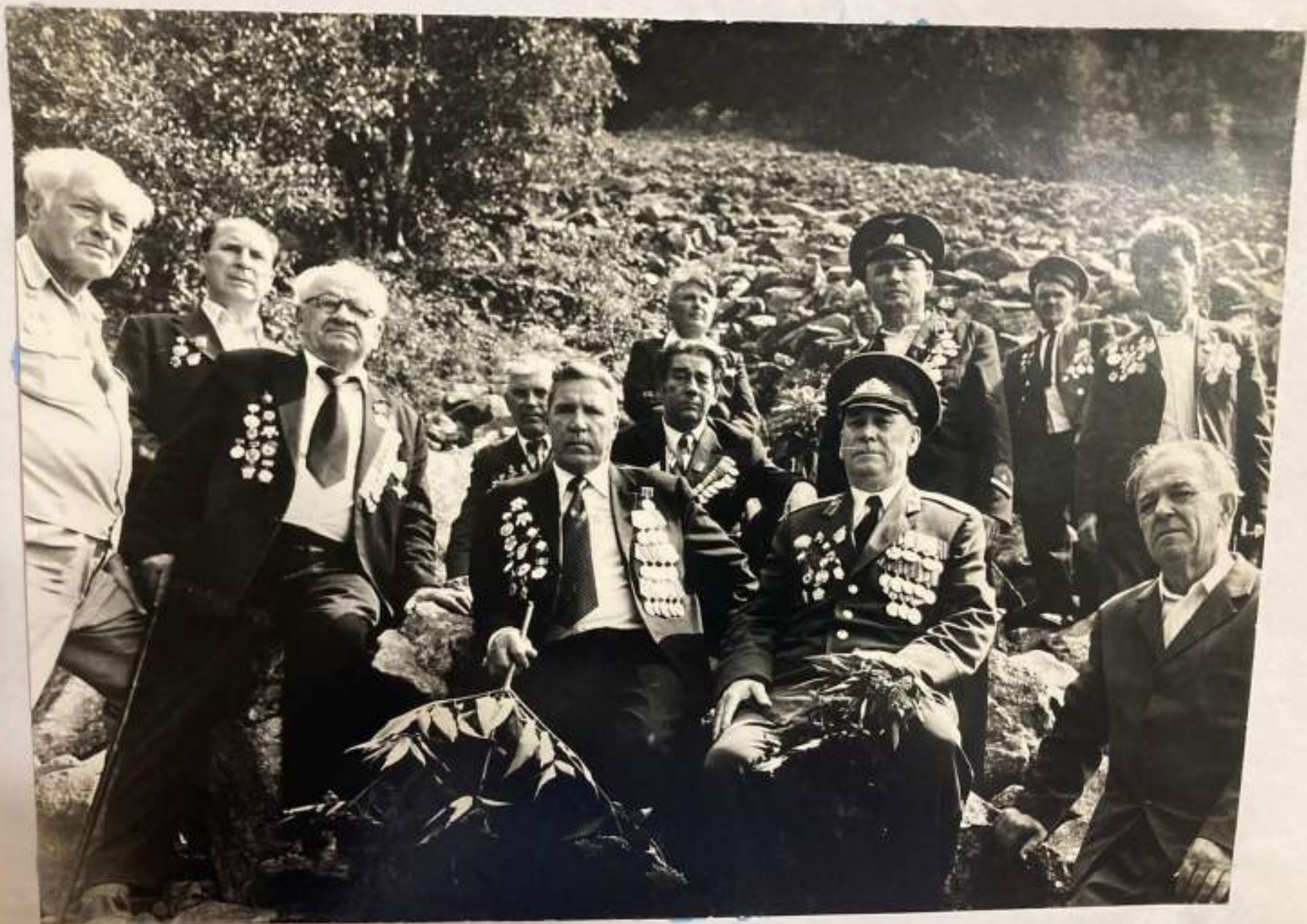
Встреча с жителями пос. Индюк, Гойтх.