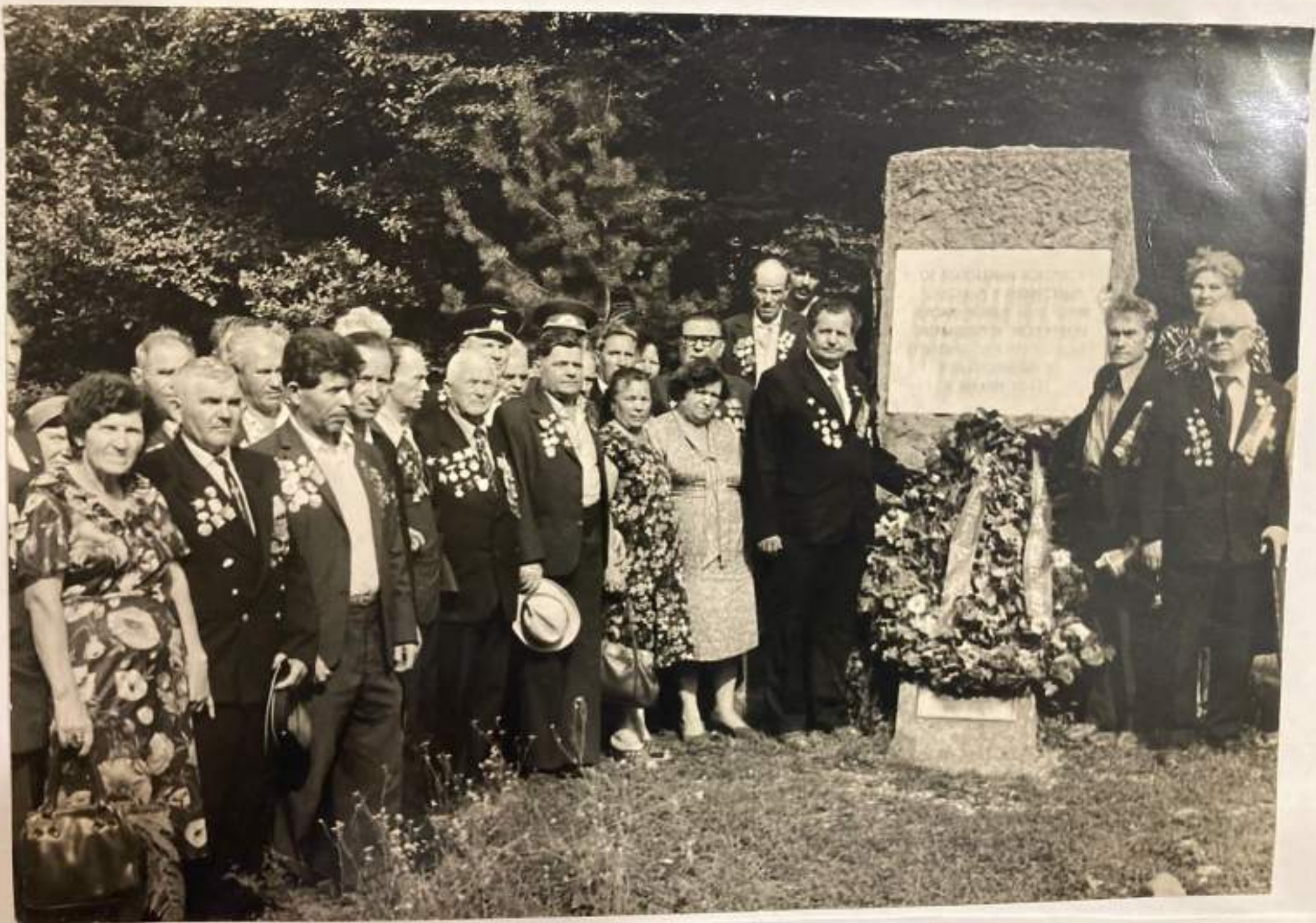
Возложение венков к памятнику.