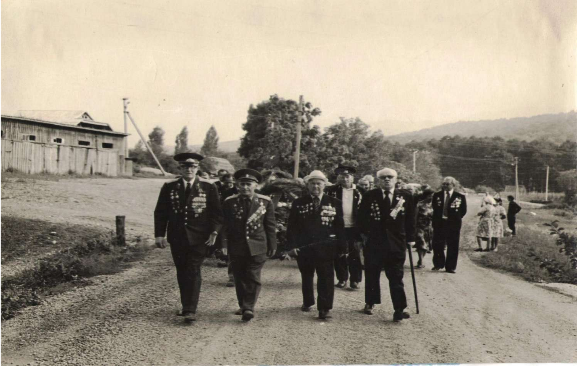
Шествие ветеранов к месту сбора для участия в митинге с.Анастасиевка