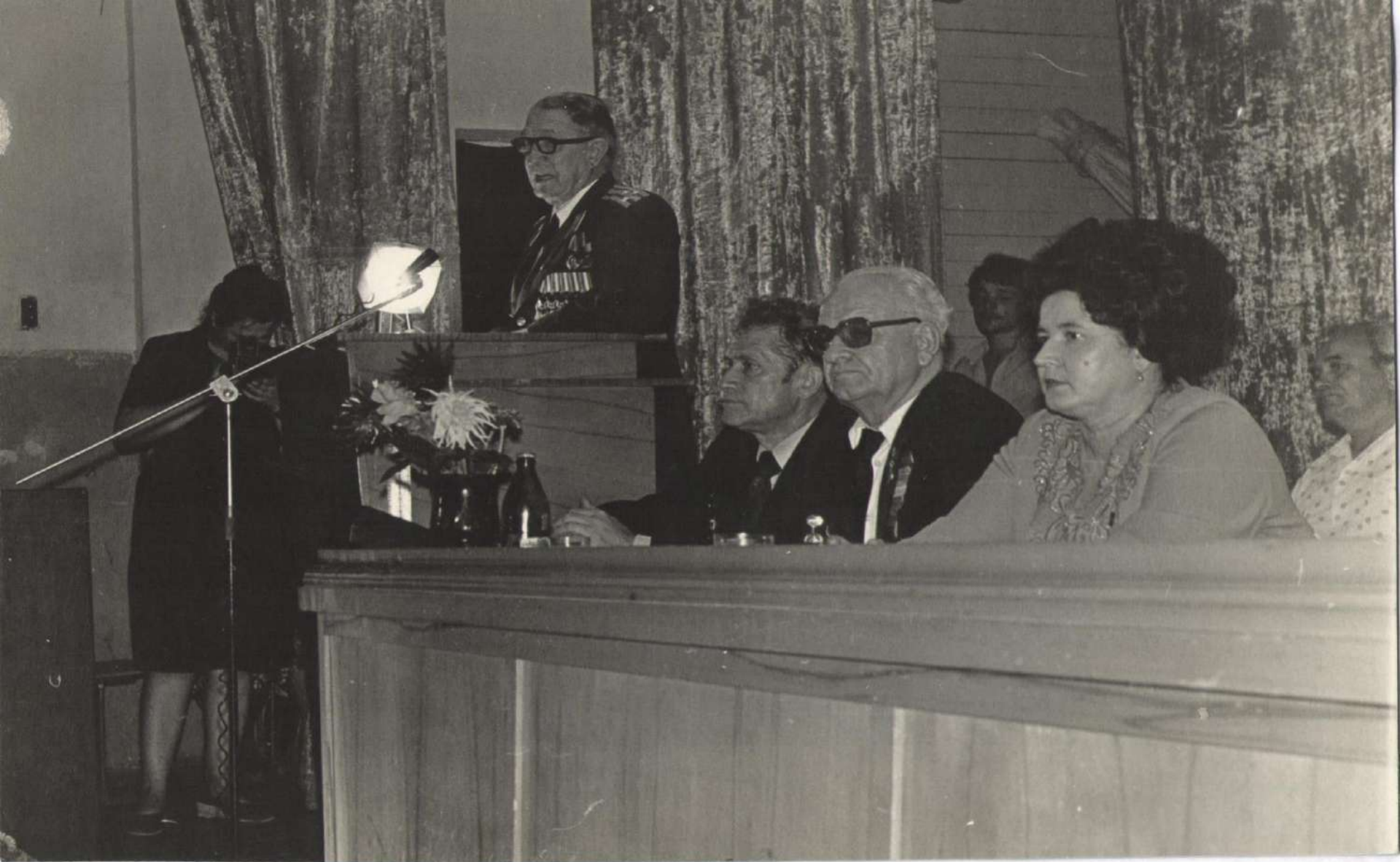
Торжественное собрание в клубе совхоза, посвященное 40-й годовщине боёв за Туапсе с участием представителей совхоза