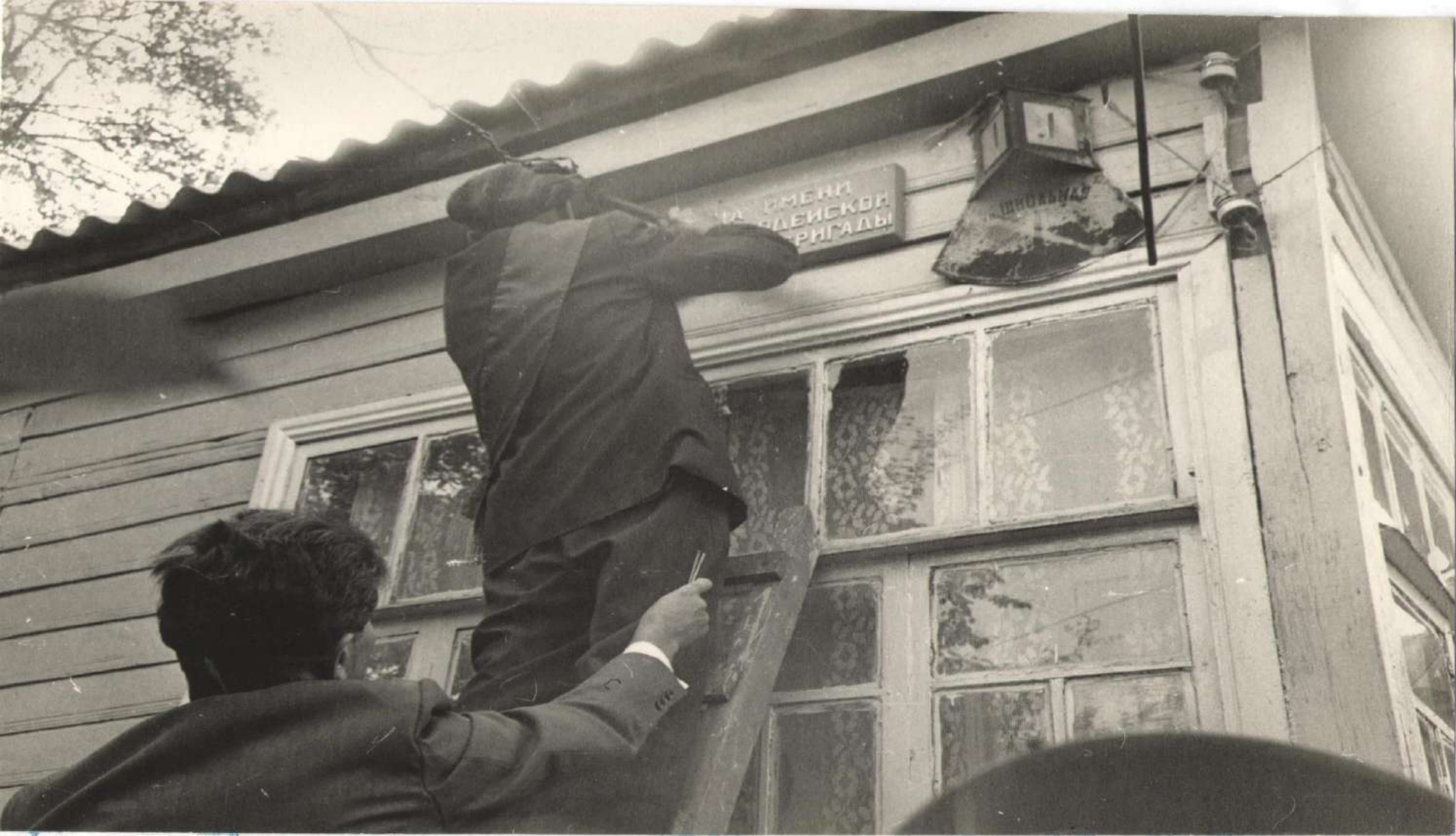
Перенаименование улицы Школьной в улицу 8-ой Гвардейской бригады. Прикрепление таблички с новым наименованием на первом доме улицы села Георгиевское 12 сентября 1982 года