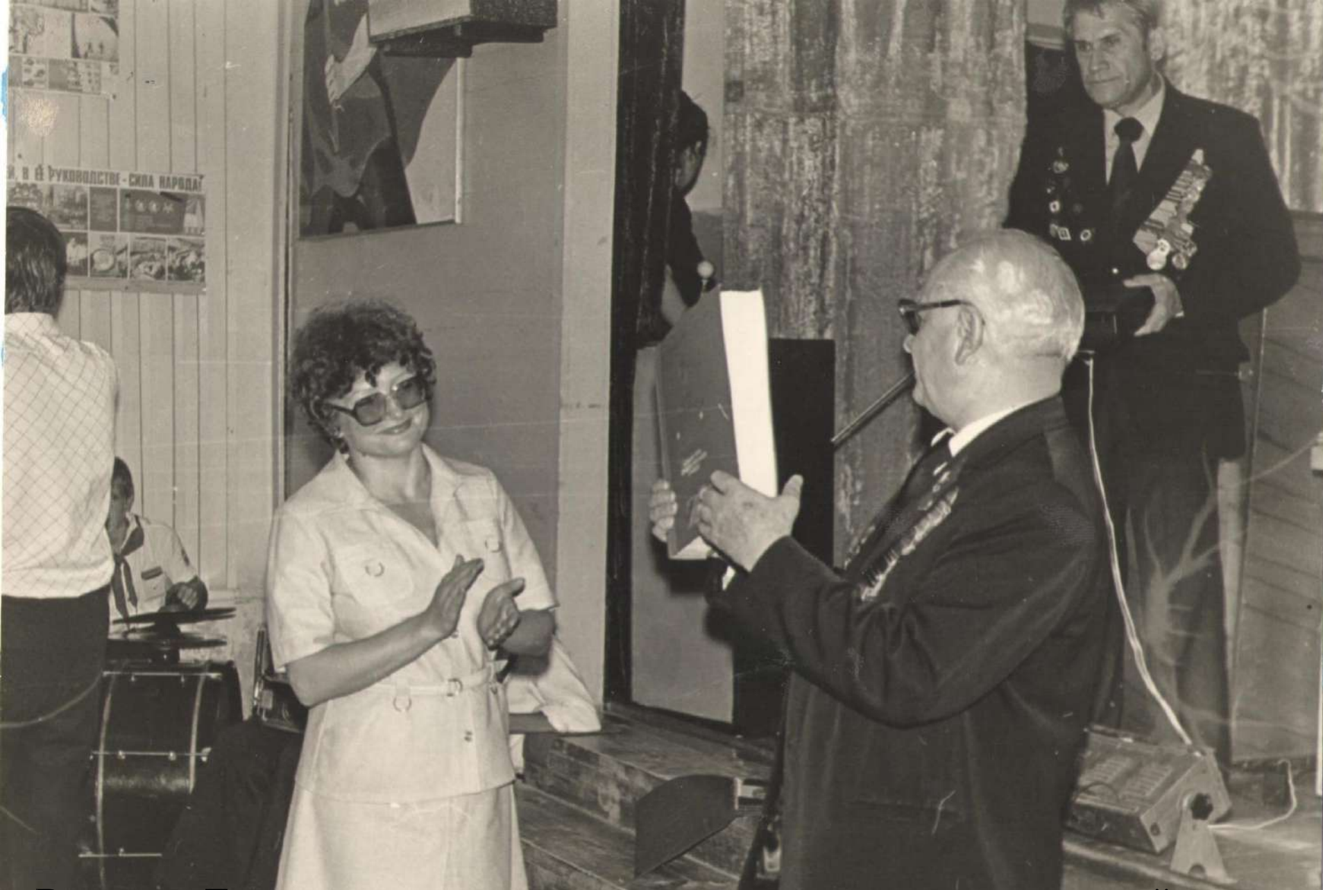
Вручение Туапсинскому историко-краеведческому музею памятной книги-альбома «От Терека до Тамани»