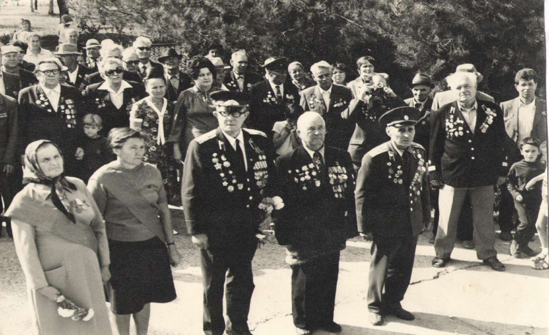
Митинг у памятника в селе Георгиевское, посвященный 40-й годовщине боёв за Туапсе