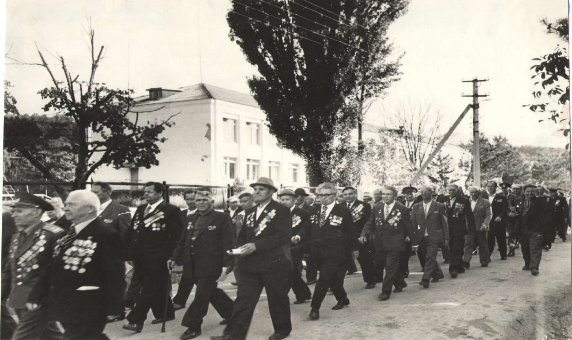
Торжественное шествие трудящихся совхоза, жителей села Георгиевское и гостей-ветеранов 8-ой Гвардейской стрелковой бригады