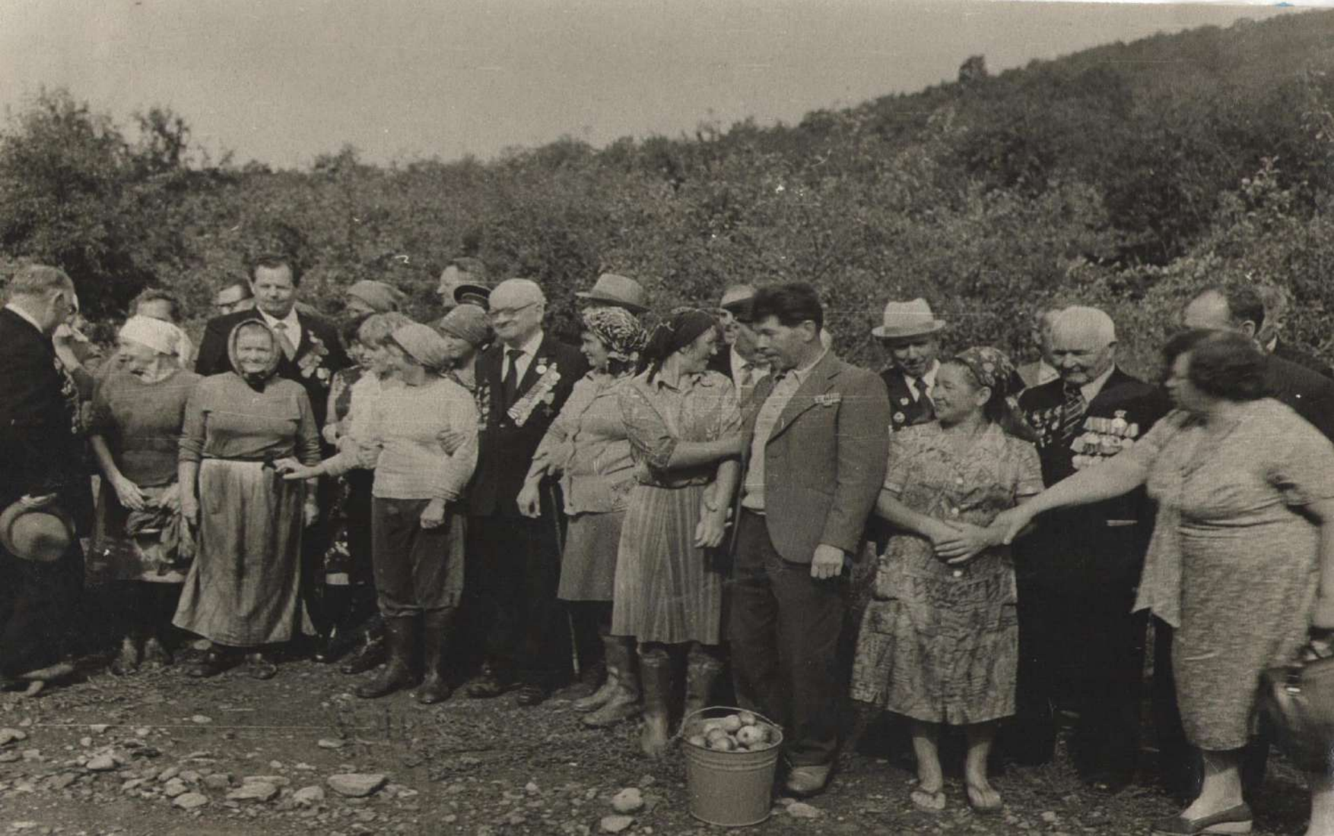
Встреча участников боёв с рабочими садовой бригады Георгиевского плодосовхоза в селе Анастасиевка