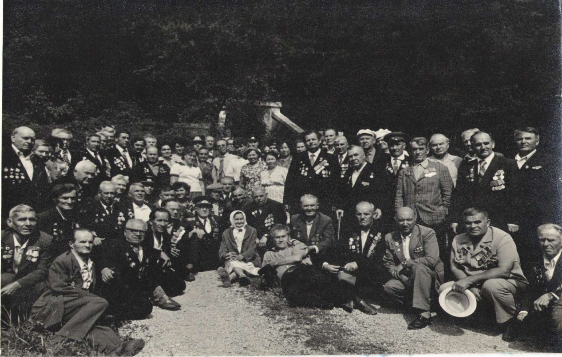
Встреча с жителями поселков Индюк, Гойтх