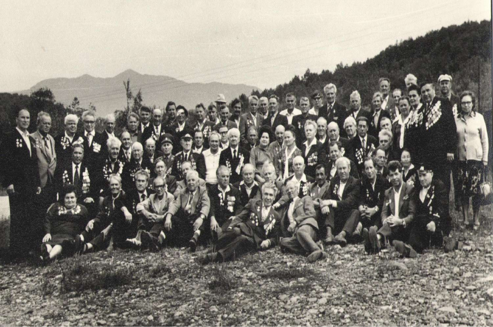
Общая памятная фотография воинов 8-ой Гвардейской стрелковой бригады у подножия горы Семашхо