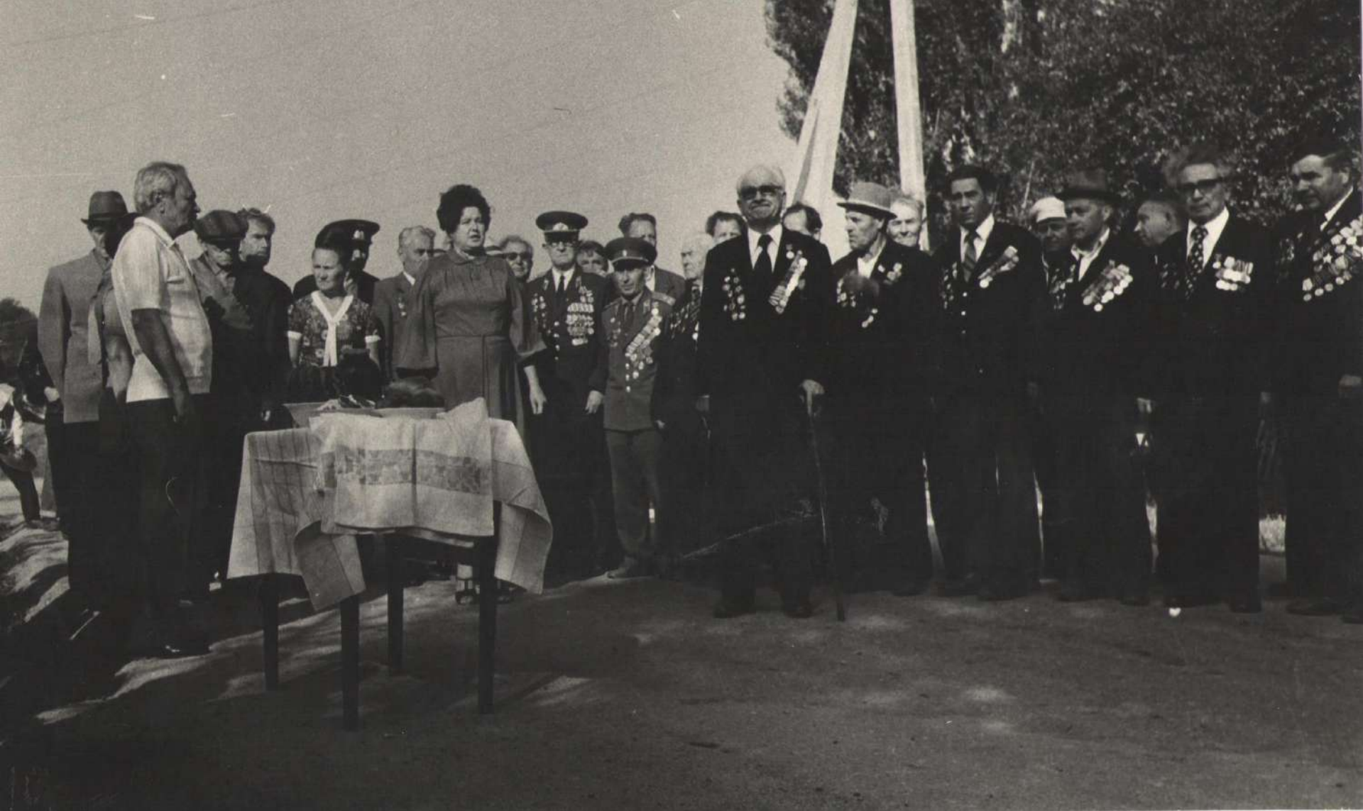
Митинг, на въезде в село, посвященный встрече ветеранов