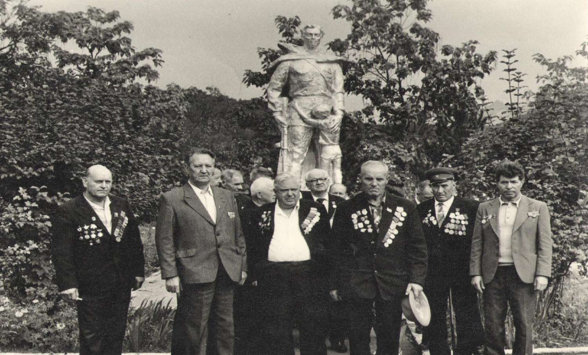
У братской могилы в с.Анастасиевка