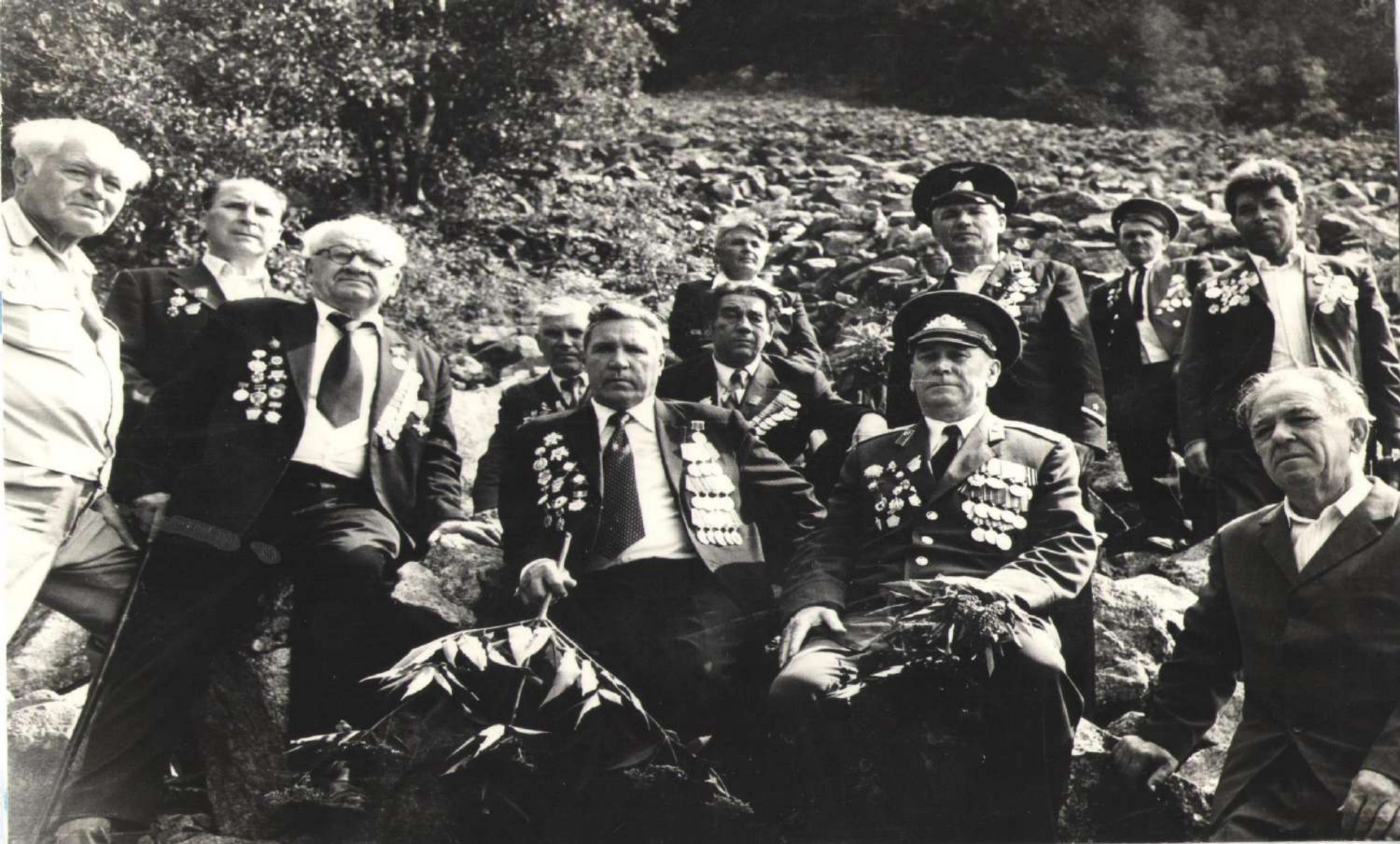
Встреча с жителями поселков Индюк, Гойтх