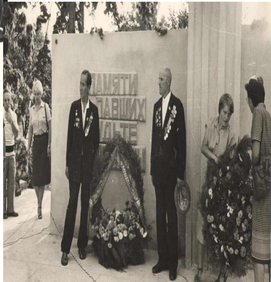
Возложение цветов к памятнику