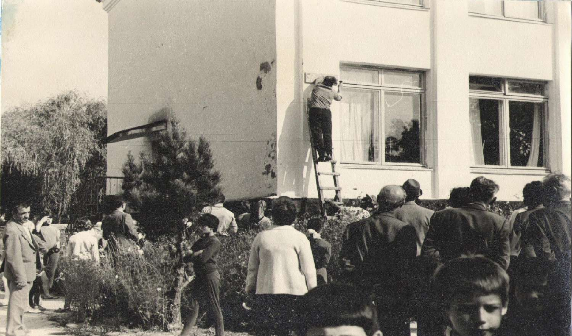
Прикрепление таблички с новым наименованием на фасаде школы. С 12 сентября 1982 года адрес школы: улица 8-ая Гвардейская, 22