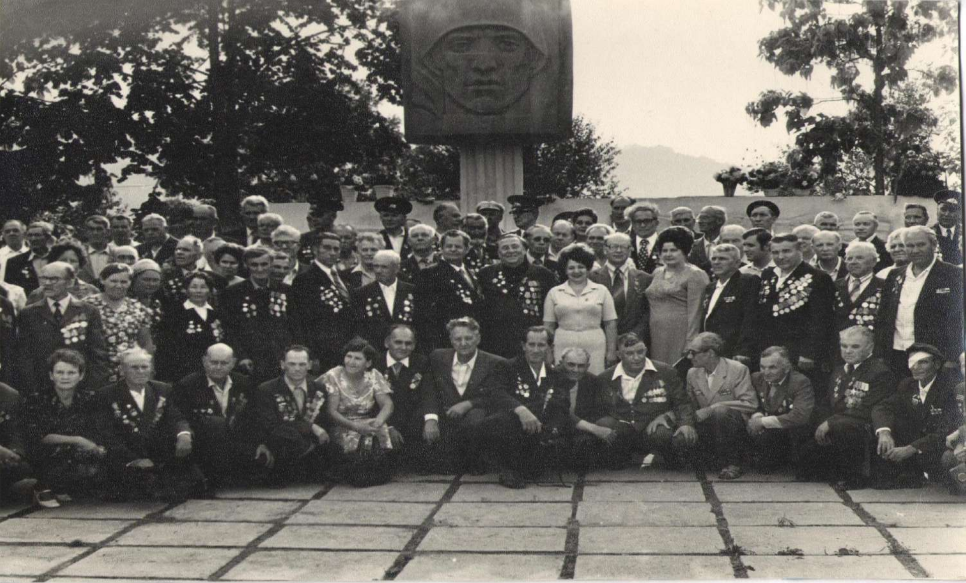
Памятная фотография воинов 8-ой Гвардейской стрелковой бригады в селе Георгиевское