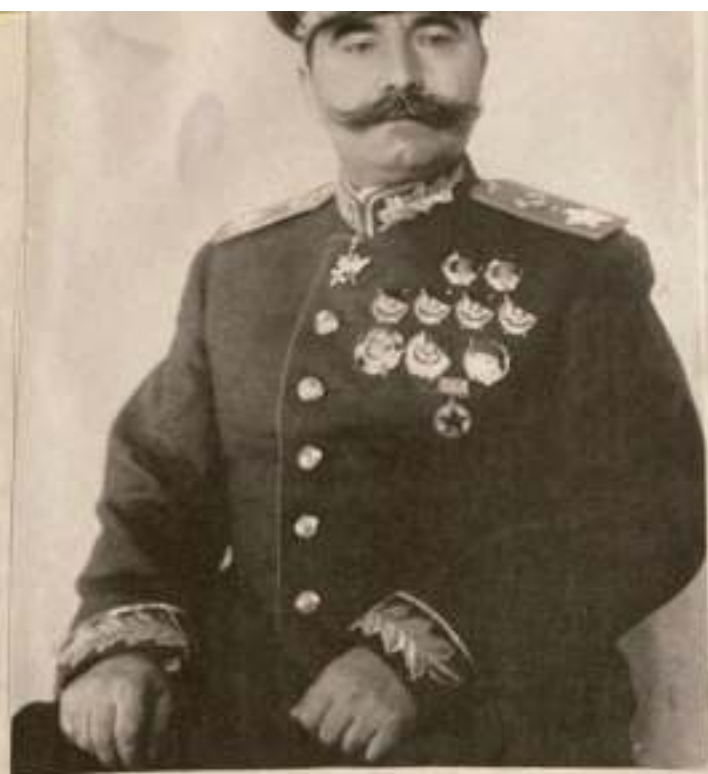
Командующий Северо-Кавказским фронтом С. М. Буденный.