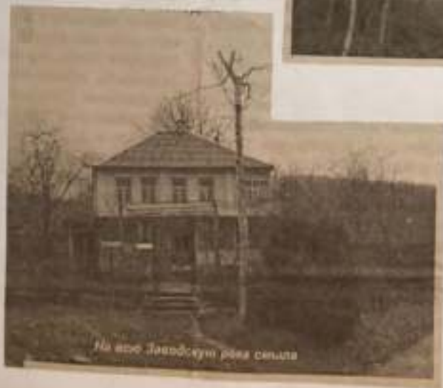
На всю Заводскую реку селитра