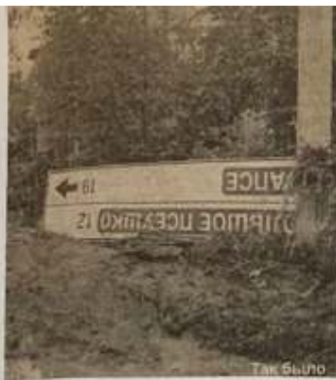
ТАК ВЫХОД НА ВЪЕЗД В СЕЛО ГЕОРГИЕВСКОЕ.